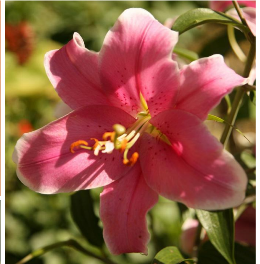
...wrześniowe kwitnienia 2017 ...