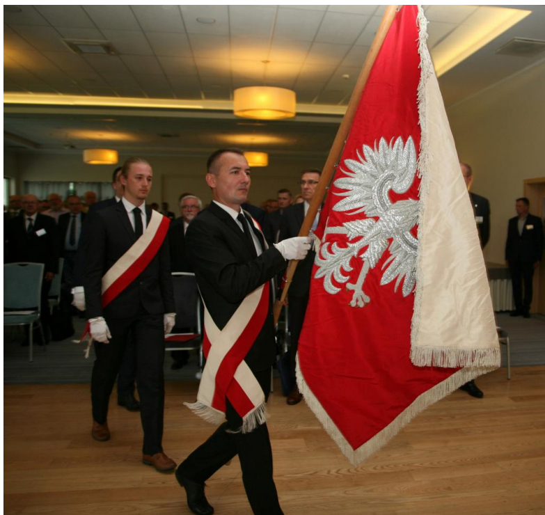
... wprowadzenie sztandaru na salę obrad XXXIX Zjazdu SGP ...;