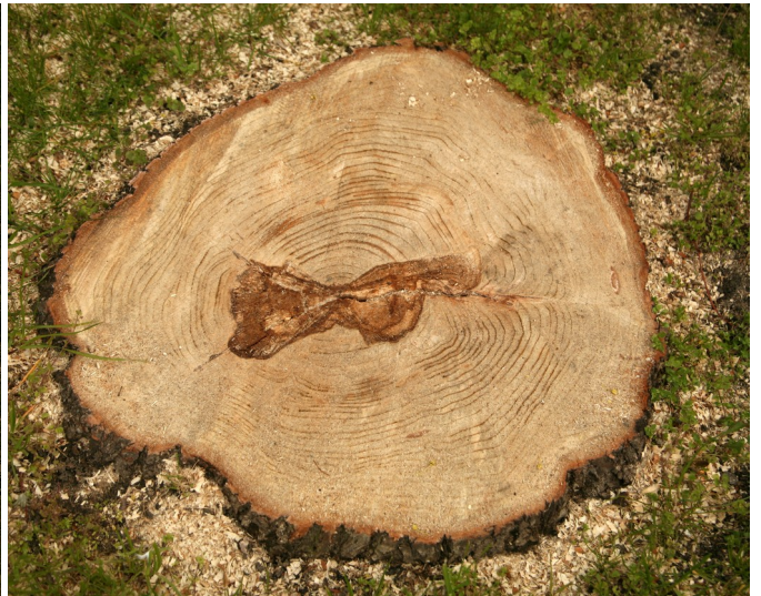
tyle zostało z drzew przy ulicy Architektów w Bydgoszczy ...