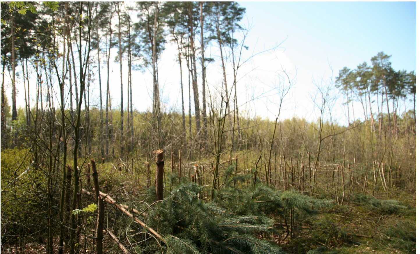
Tak usuwa się samosiejki w nasadzeniu lasu bębowego, po zachowniej stronie ulicy Dąbrowa.