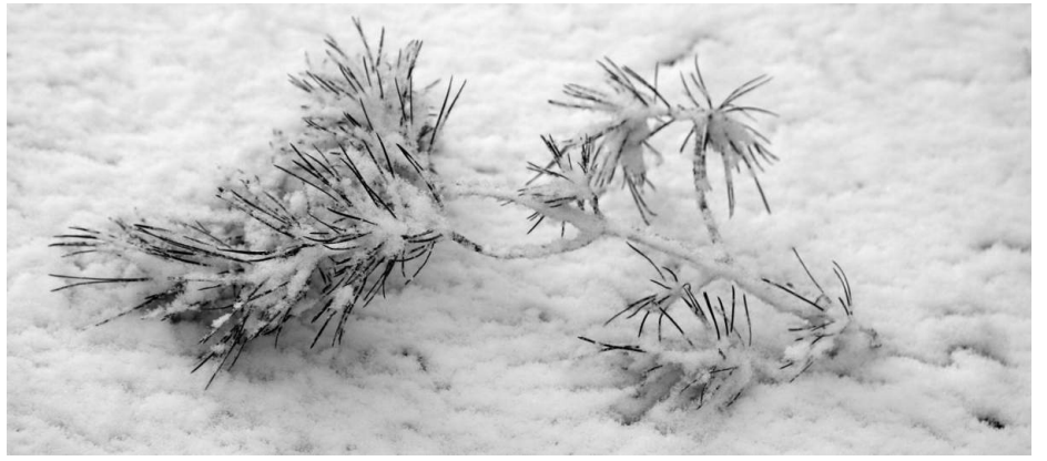
...jednodniowa lutowa śnieżna zima roku 2017 w Bydgoszczy ...