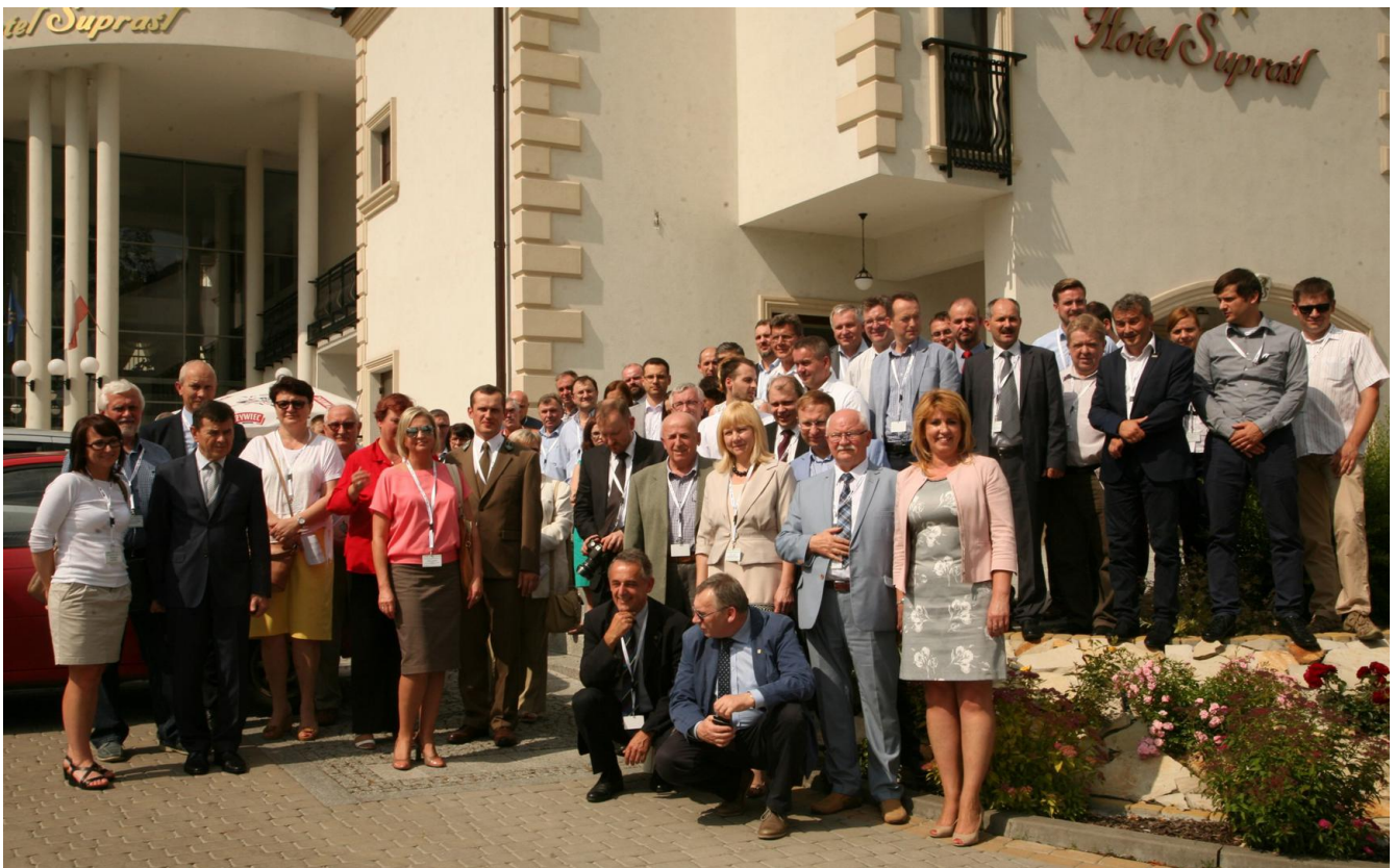
... uczestnicy Konferencji przed hotelem „Supraśl” ...