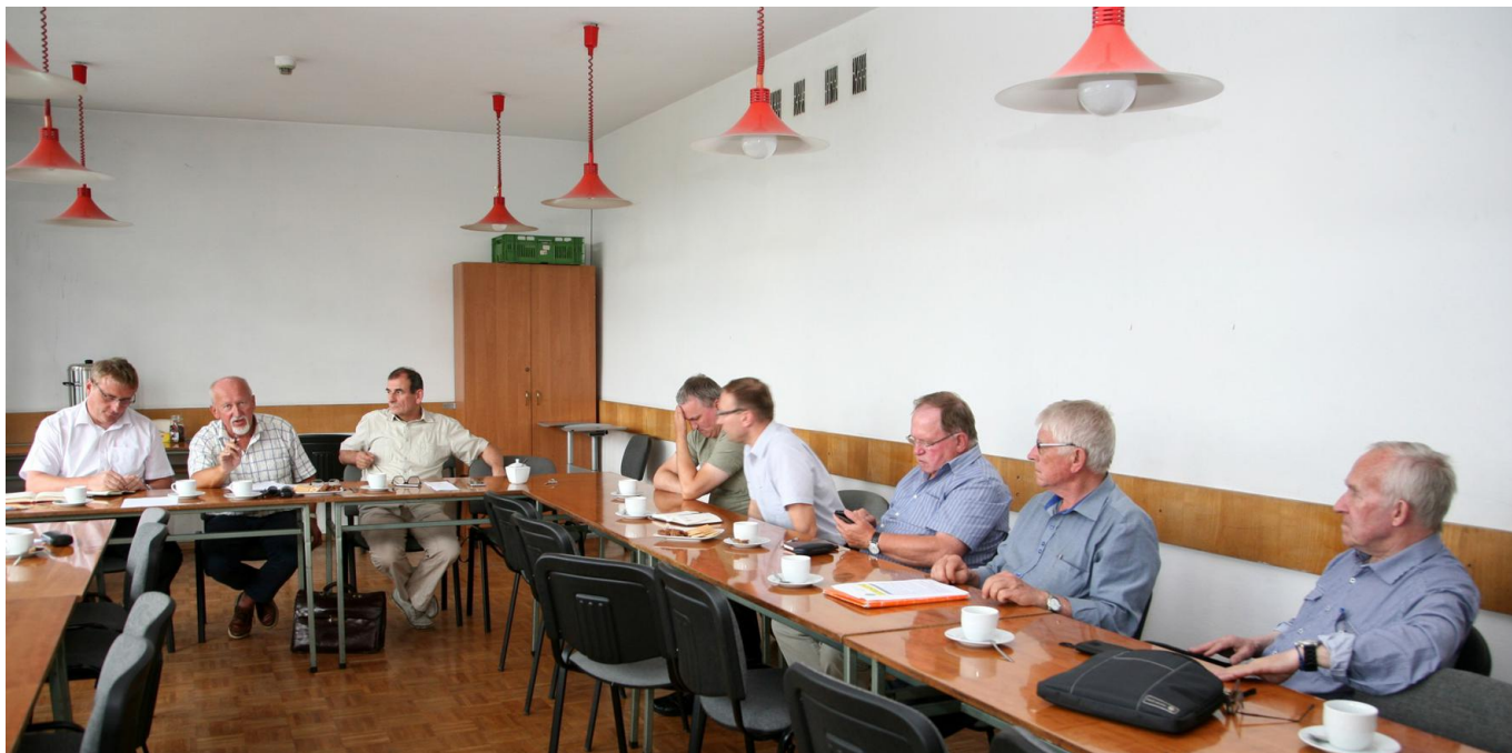
Uczestnicy zebrania na sali obrad ...

interesujących propozycjach przygotowanych przez organizatorów wydarzenia. Ale po kolei. Pierwszego dnia po południu obradował Zarząd Główny, rozpatrując rozmaite sprawy Stowarzyszenia i podejmując stosowne rozstrzygnięcia. Wrocławianie nie byłiby sobą, gdyby zaproszonych gości nie zaprowadzili nad Odrę i zaprosili na spacer statkiem po jej wodach. Spojrzenie na miasto z poziomu rzeki dawało inne, inspirujące przeżywanie piękna jego budowli i przyrody. Sprzyjała temu wspaniale letnia pogoda i urok barw nieba w porze zachodzącego słońca.