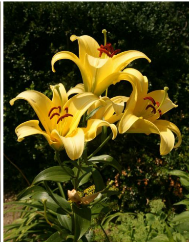
... „lilowaty” lipiec 2016 ...