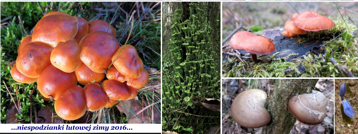
...niespodzianki lutowej zimy 2016...