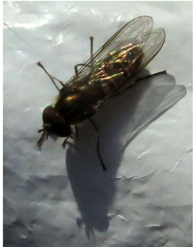
... rozmaitości grudnia 2019 roku ...