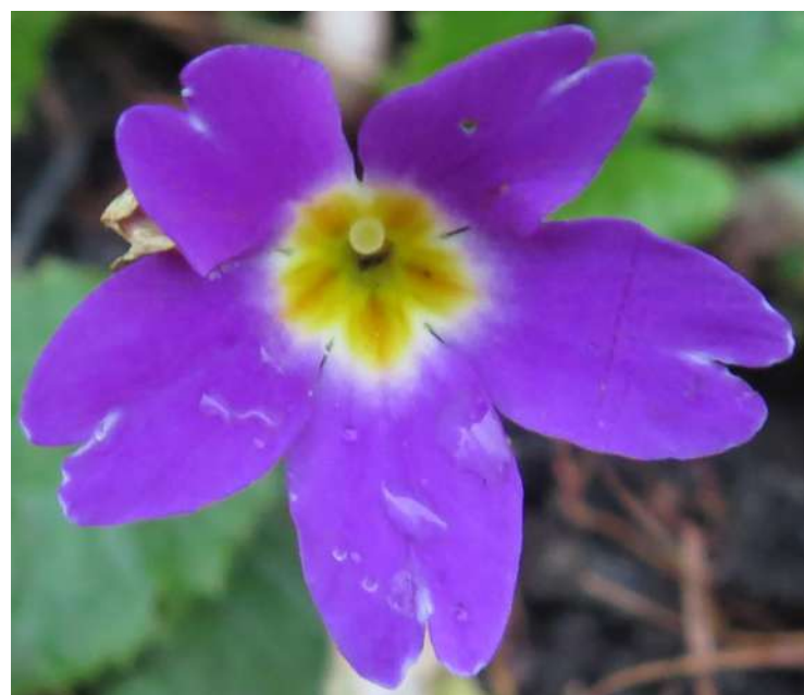
... w grudniu 2019 roku ...