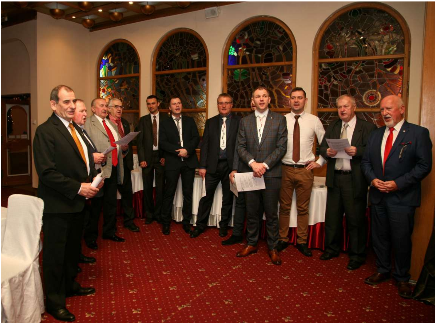
Powyżej: Spontanicznie powołany chór „Bracia patrzcie jeno ...” śpiewa kolędy. Poniżej: chór „Głosy anielskie” śpiewający kolędy ...