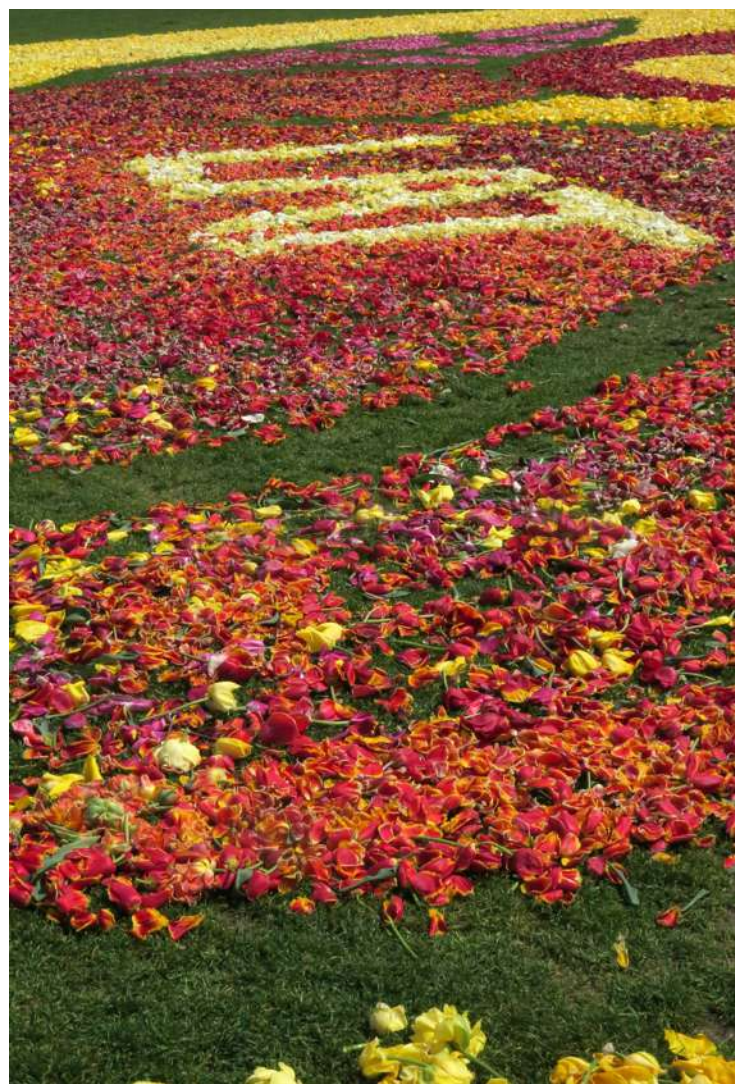
... efekt wspólnej troski i wysiłku ogrodników i uczniów bydgoskiej szkoły plastycznej ...