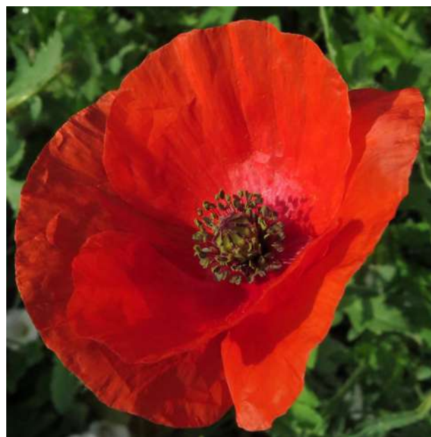
... na poboczach bydgoskich dróg nie tylko maki ...