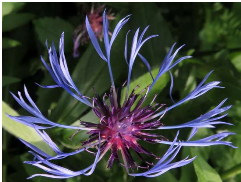
... maki, chabry, irysy ...