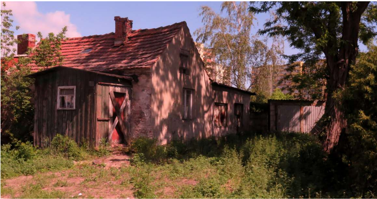
... odrobina dawnej Bydgoszczy (Glinki) ...