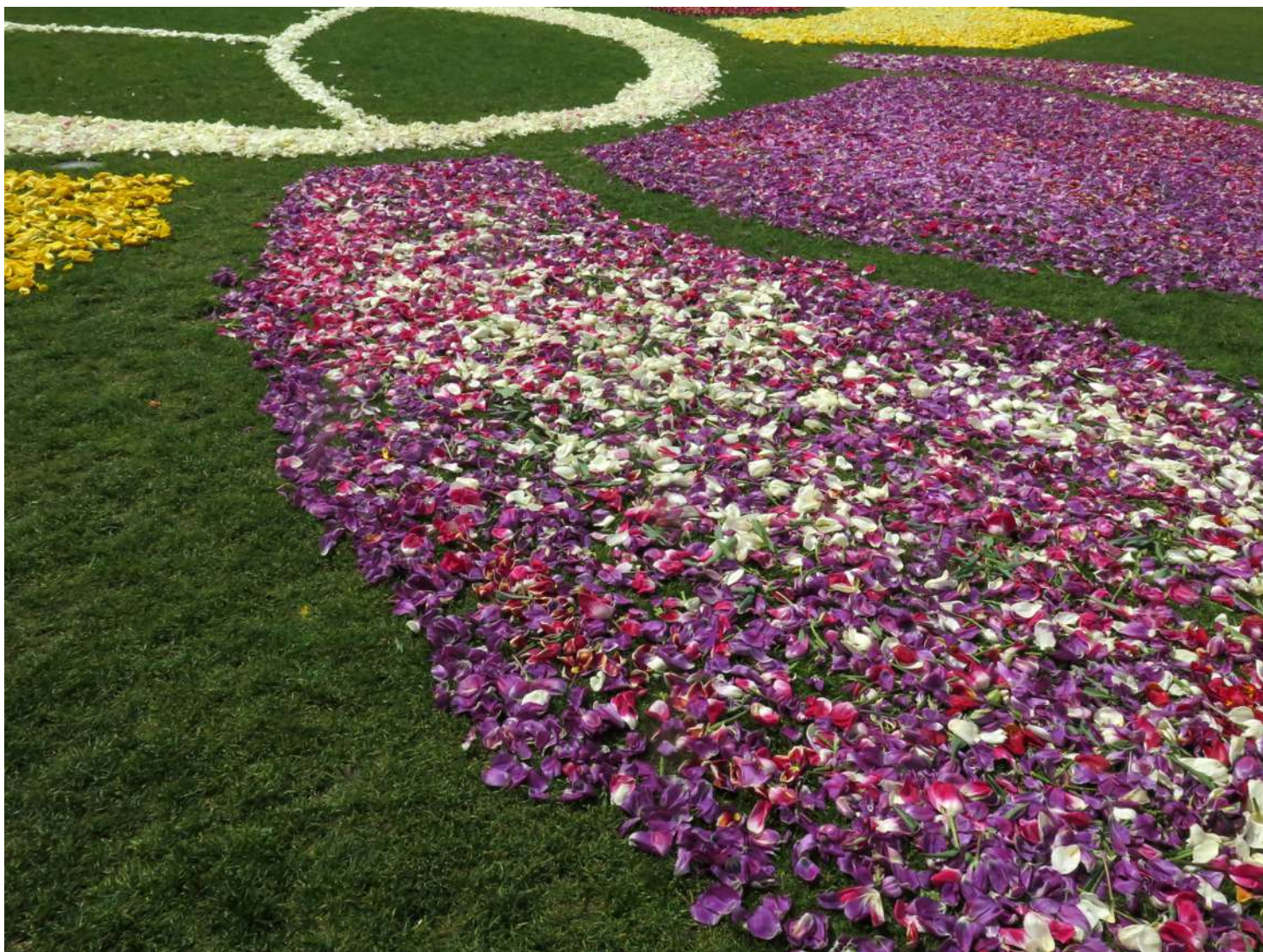
... krótkie przywołanie tulipanowej prezentacji SITO na trawniku Wyspy Młyńskiej ...