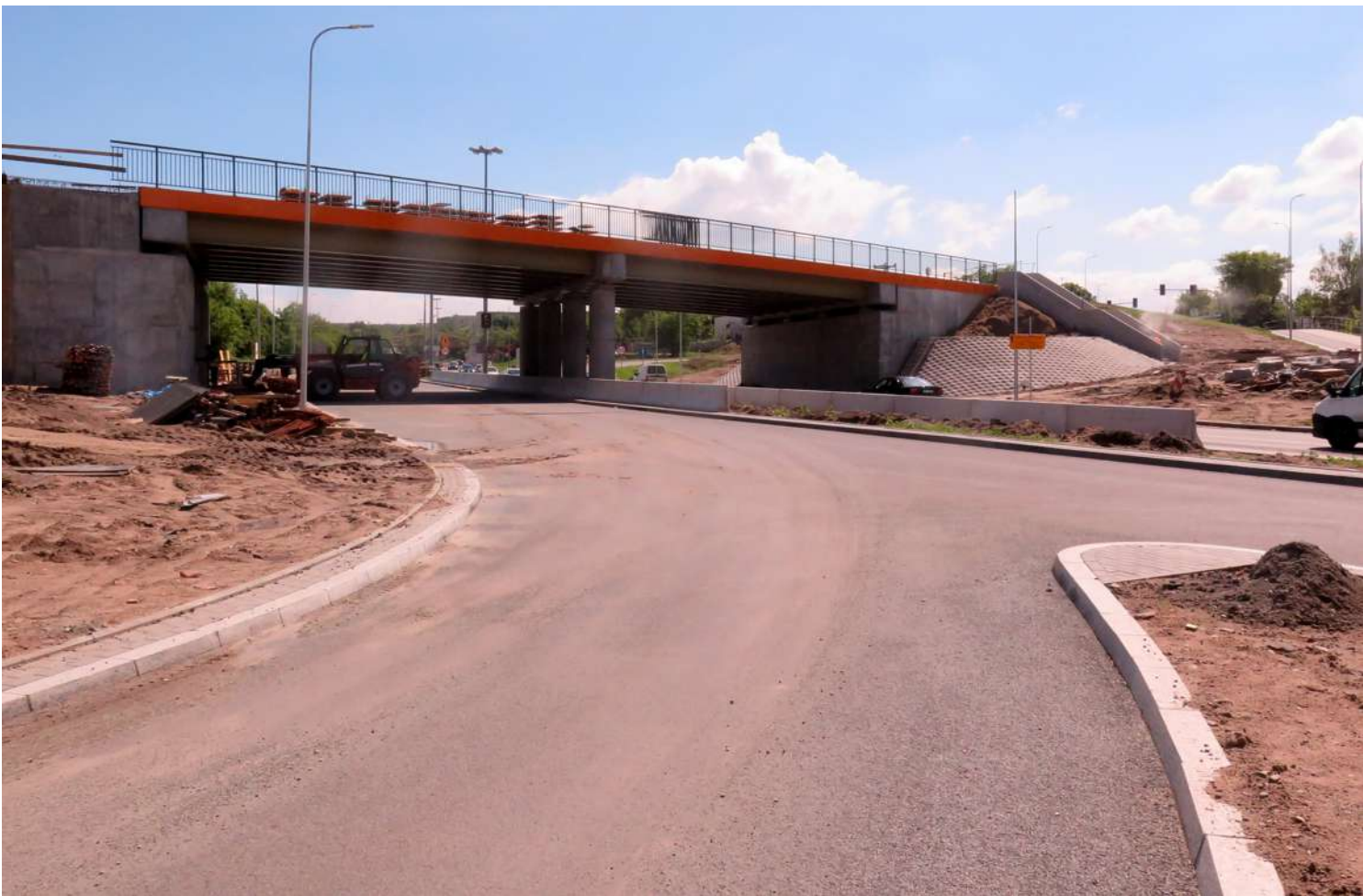
Wiadukt łączący Trasę Uniwersytecką z ulicą Glinki w Bydgoszczy, nadal w budowie ...