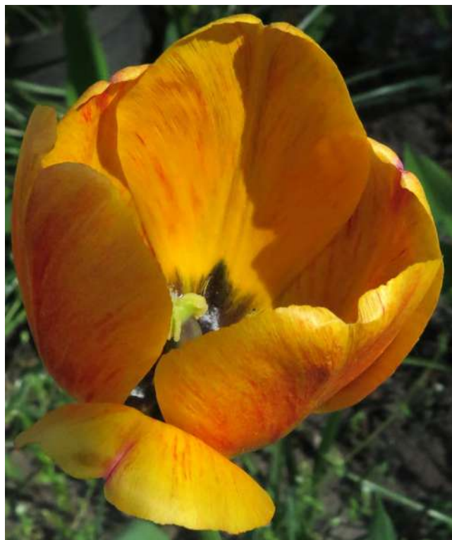
... majowe różnorodności kwiatowych ogrodów roku 2019 ...