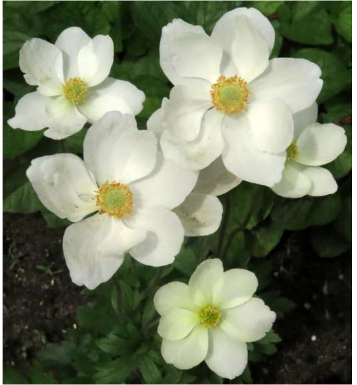
... rozmaiłości maja 2019 roku ...