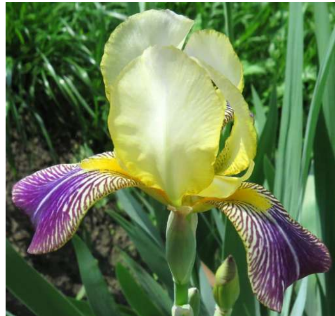
...na یرysowo w maju 2019 roku ...