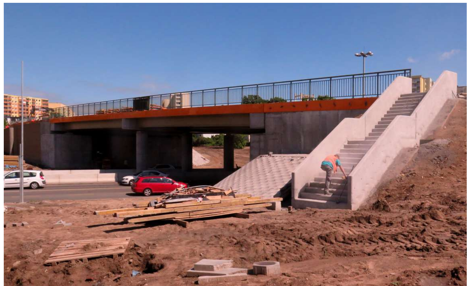
Wiadukt nad Aleją Jana Pawła II w Bydgoszczy nadal pozostaje w budowie ...