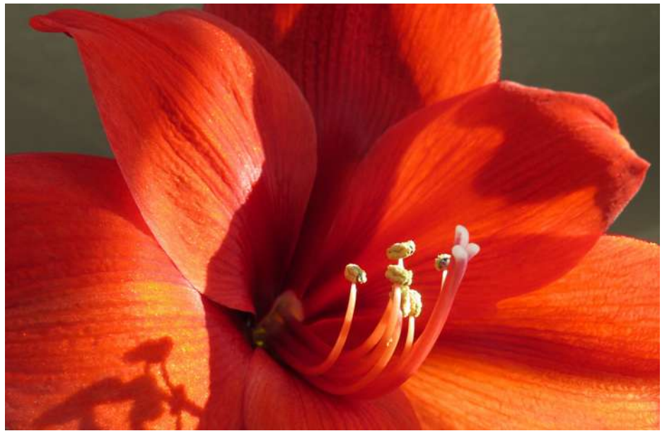
... wiosna (?) w lutym 2019 roku ...