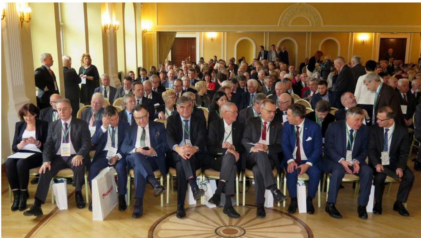
Uczestnicy spotkania w oczekiwaniu na rozpoczęcie uroczystości