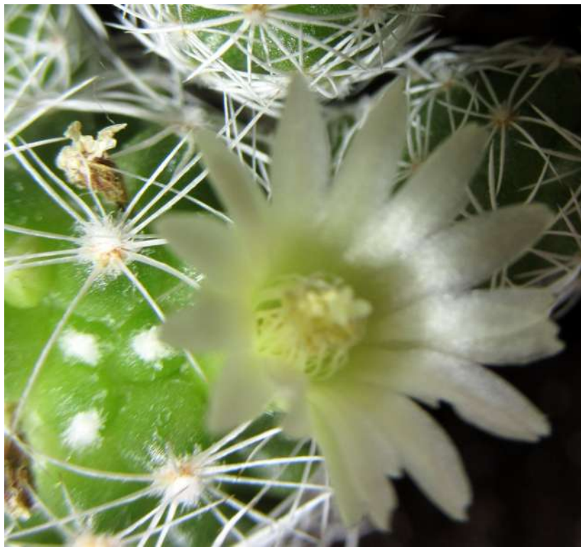
... w styczniu 2019 roku ...