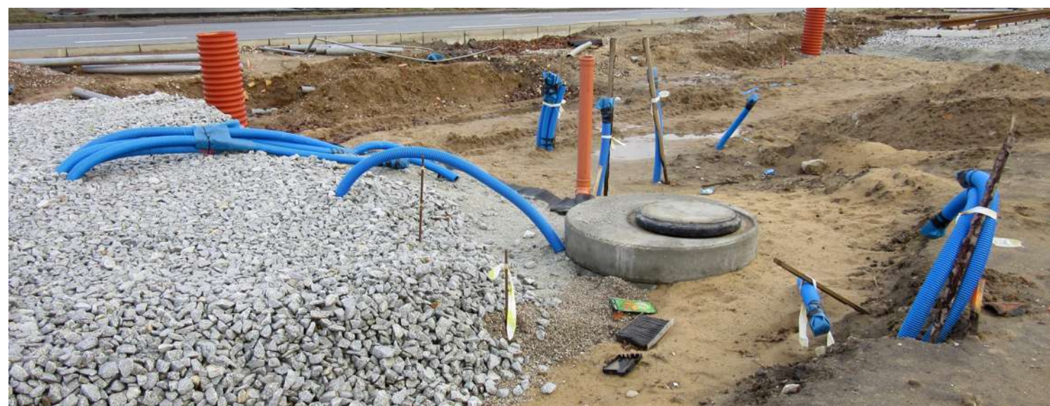
Na przebudowywanej drodze miejskiej czeka na geodetów inwentaryzacja urozmaiconego uzbrojenia technicznego terenu