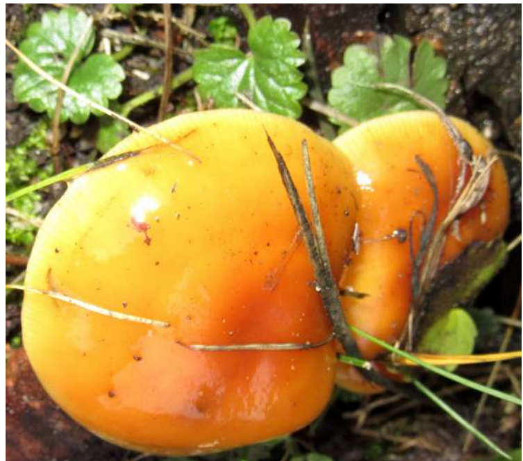
... zima stycznia 2019 roku ...