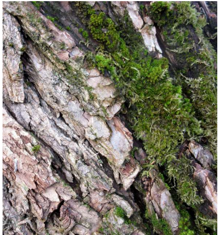
... w styczniu 2019 roku ...