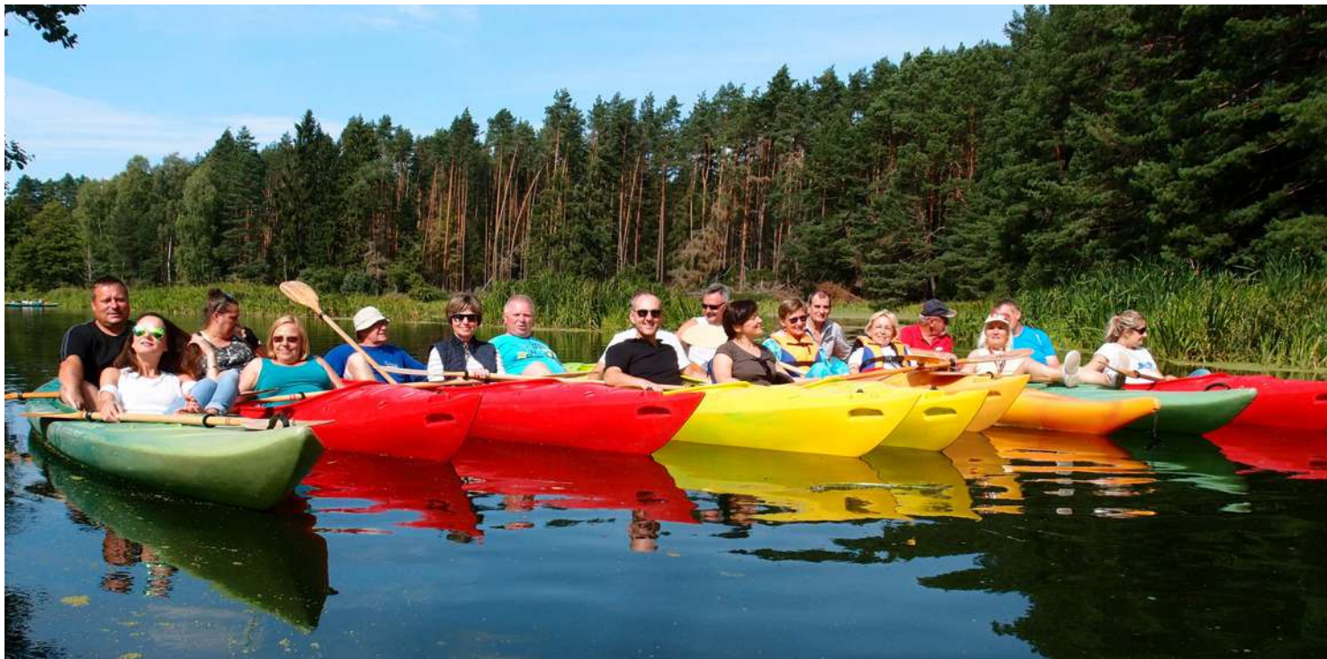
... odpoczynek na wodzie ...

skuteczności i bezkompromisowości w dążeniu do obranego celu. Ktoś powiedział, że chodzi o siłę przebicia . Mam nadzieję, że Pan Minister powie nam coś ku pokrzepieniu serc .