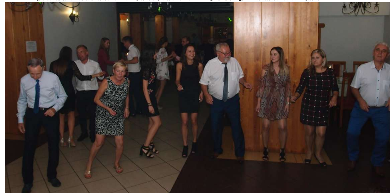
Powyżej i poniżej uczestnicy zjazdowego spotkania podczas zabawy na parkiecie ...