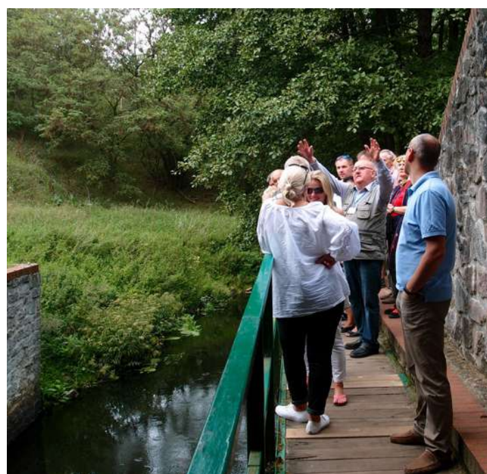
U góry: na wycieczce z przewodnikiem. Powyżej: skrzyżowanie wód Strugi Czerskiej z wodami płynącymi (wyżej) Wielkiego Kanału Brdy; „co warto wiedzieć” mówi przewodnik. Poniżej: Uczestniczący w zjeździe na Kładce przez Kanał.