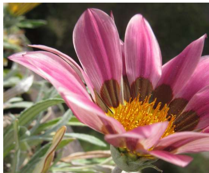
... wrzesień 2018 roku rozkwitły wieloma barwami gazanii ...