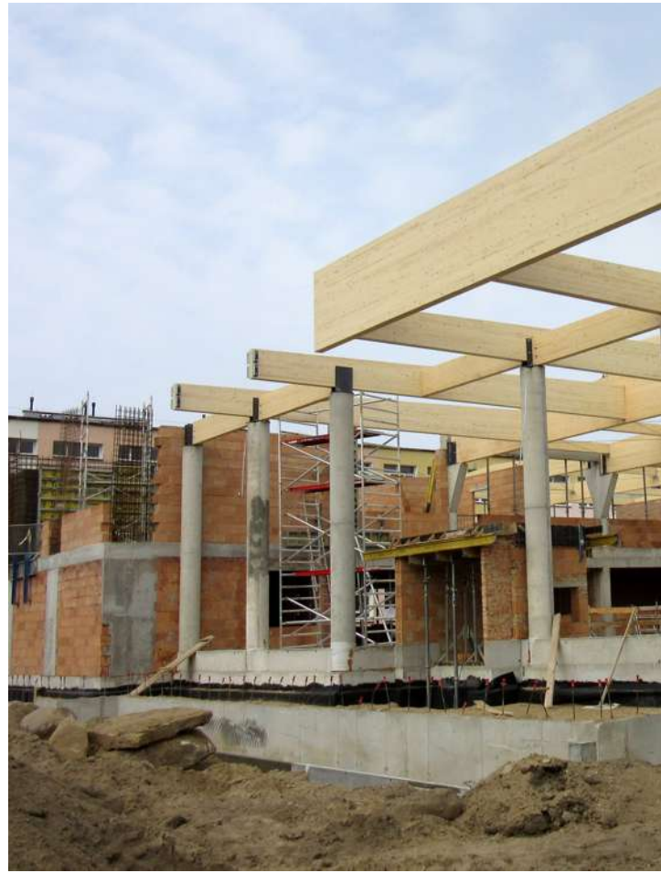
... przy V Liceum Ogólnokształcącym w Bydgoszczy wznosi się szkolny basen pływakki ...