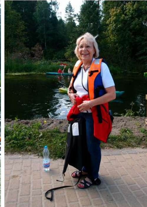
... na kajakowy spływ po wodach Wielkiego Kanalu Brdy ...;