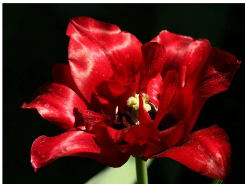
...rozmaitości maja 2018 ...