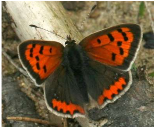
... w maju 2018 roku ...