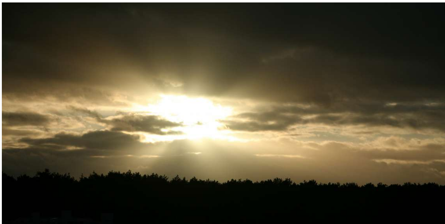
... styczniowe niebo 2018 roku, przed zachodem ...