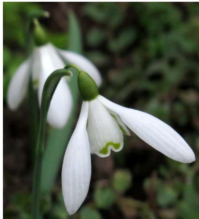
... lutowe kwitnienia 2020 roku ...