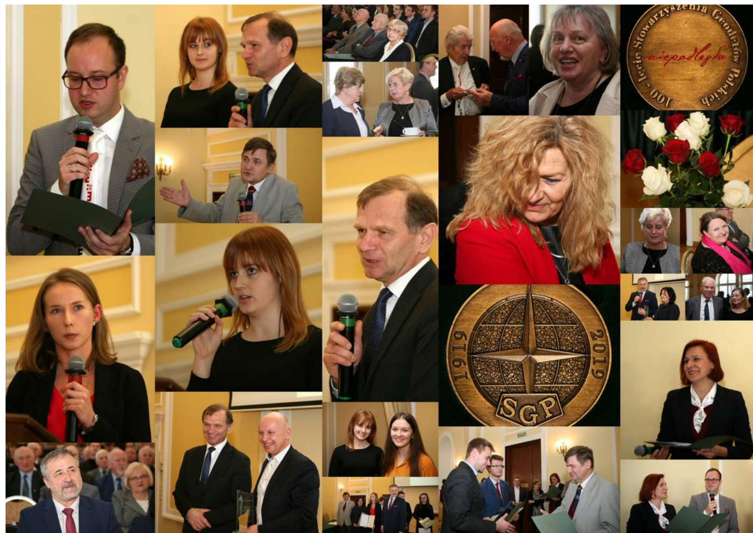
... zebrane obrazki z noworocznego zebrania Zarządu Głównego SGP w dniu 7 lutego 2020 roku ...