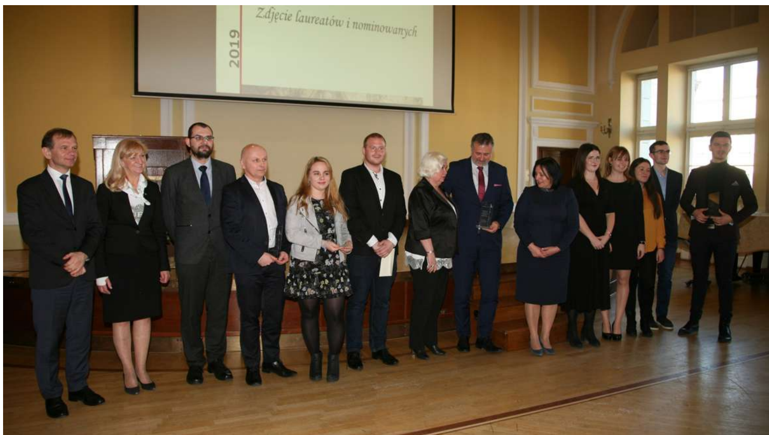
Organizatorzy i laureaci plebiscytu studenckiego GeoAzymuty 2019