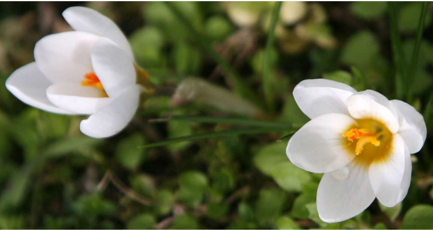
... co zakwitło w lutym 2020 roku ...