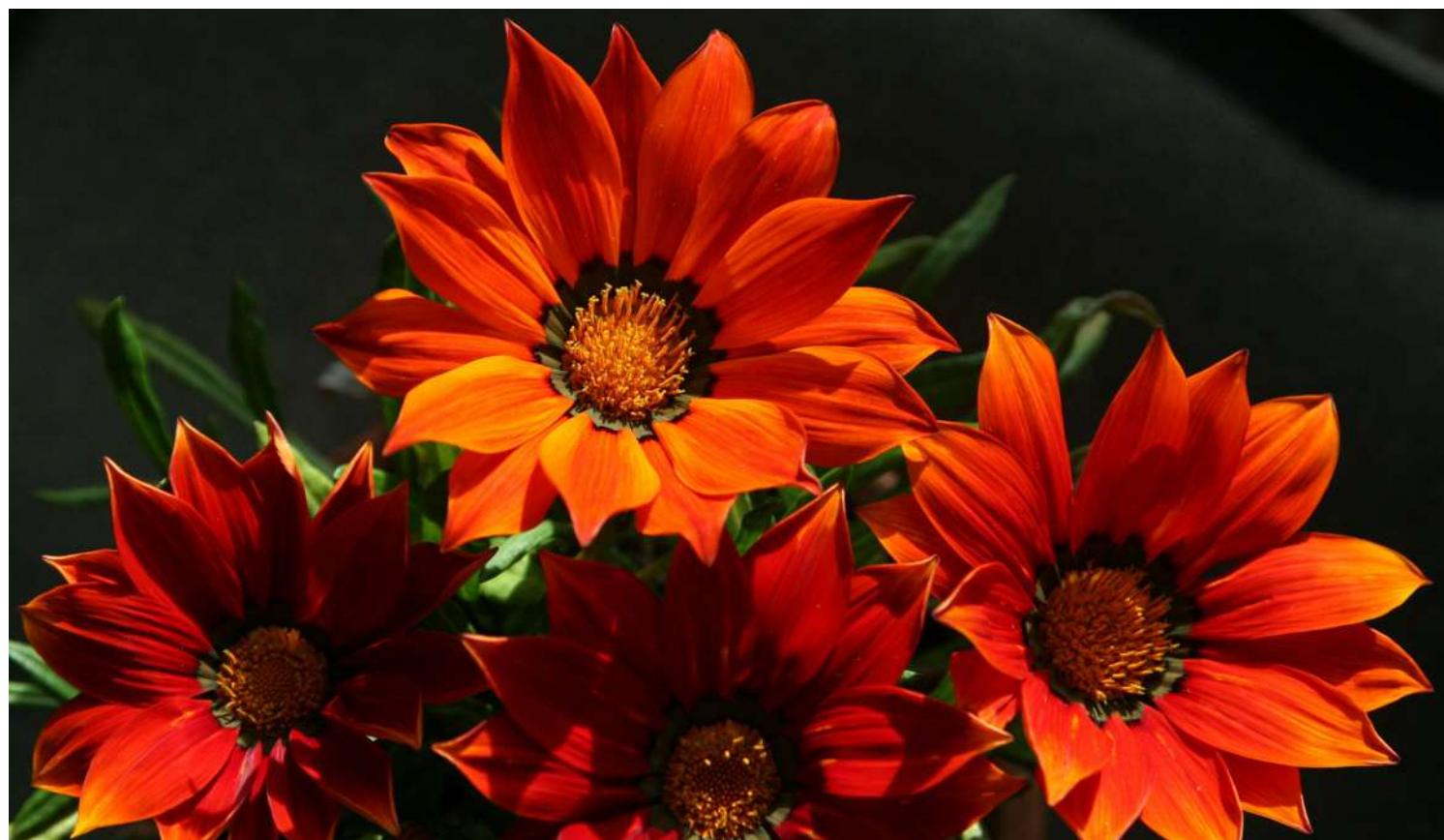
... GRUDNIOWE ROZMAITOŚCI ROKU 2019 ...