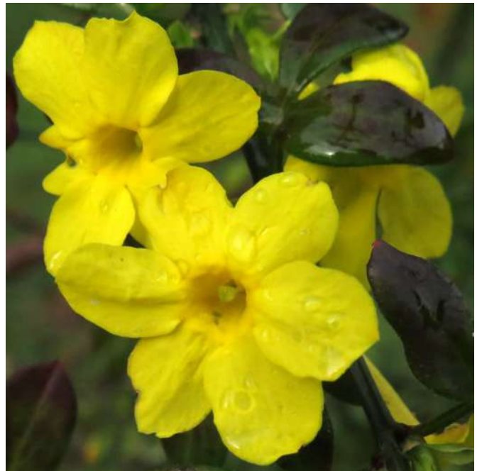
... grudniowe rozmaiłości 2019 roku ...