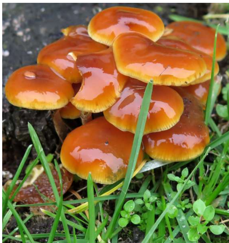
... listopadowe kwitnienia 2019 roku ...