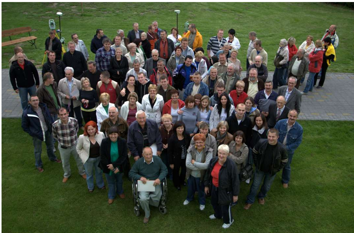
Uczestnicy regionalnego zjazdu geodetów Pomorza i Kujaw, jaki odbył się w roku 2008 w Tleniu.