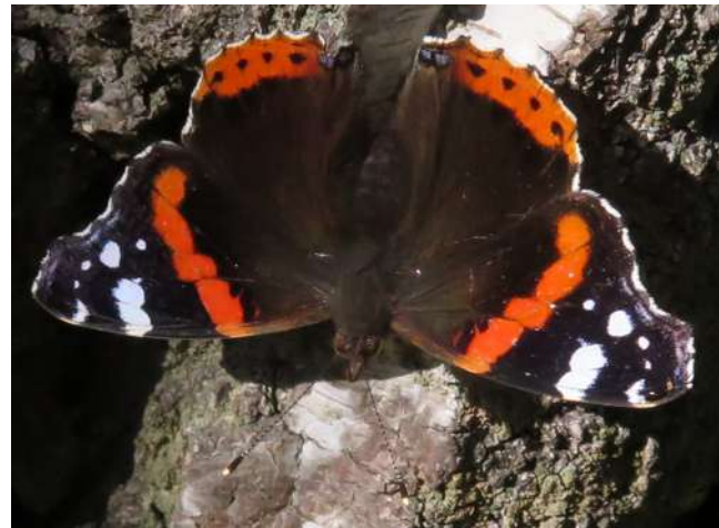
rozmaitości października 2019 roku