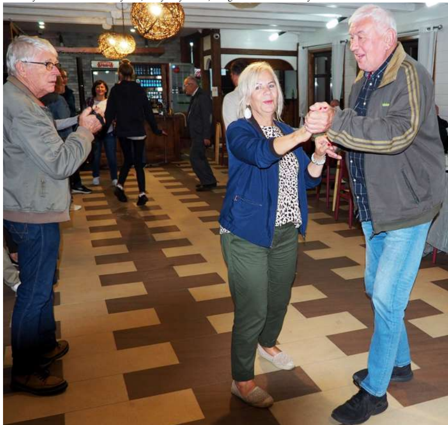
Wieczór wypełniała zabawa przy grillu (pod dachem), z tańcami i wspólnym śpiewaniem.