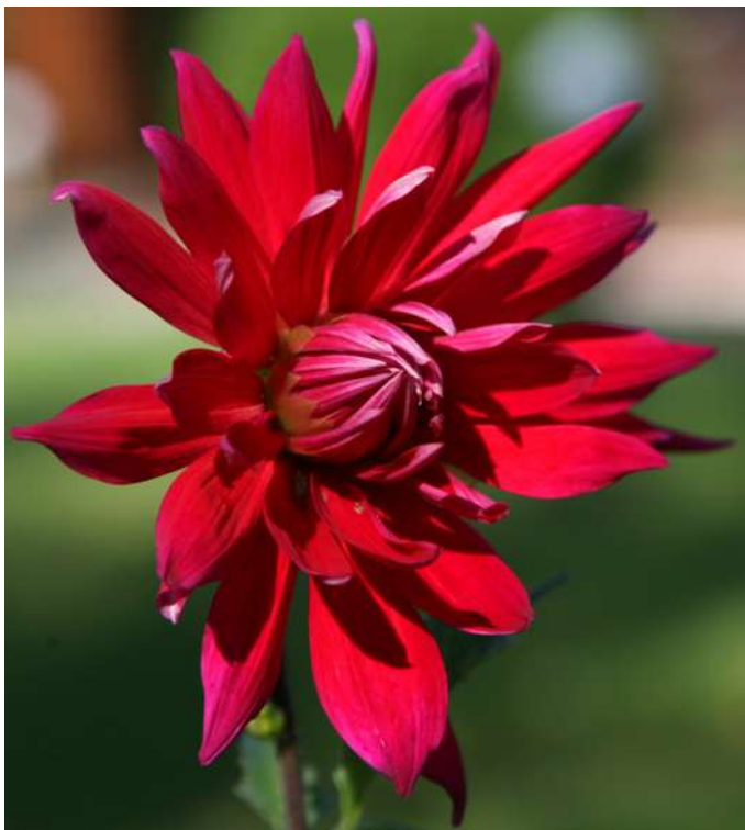
... różności września 2019 roku ...