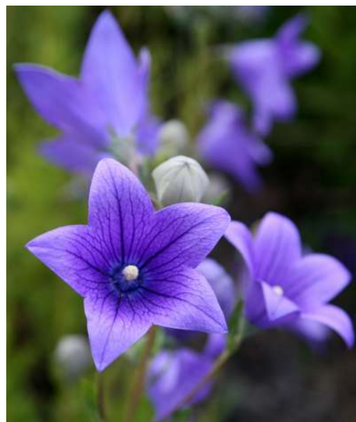
... różności września 2019 roku ...