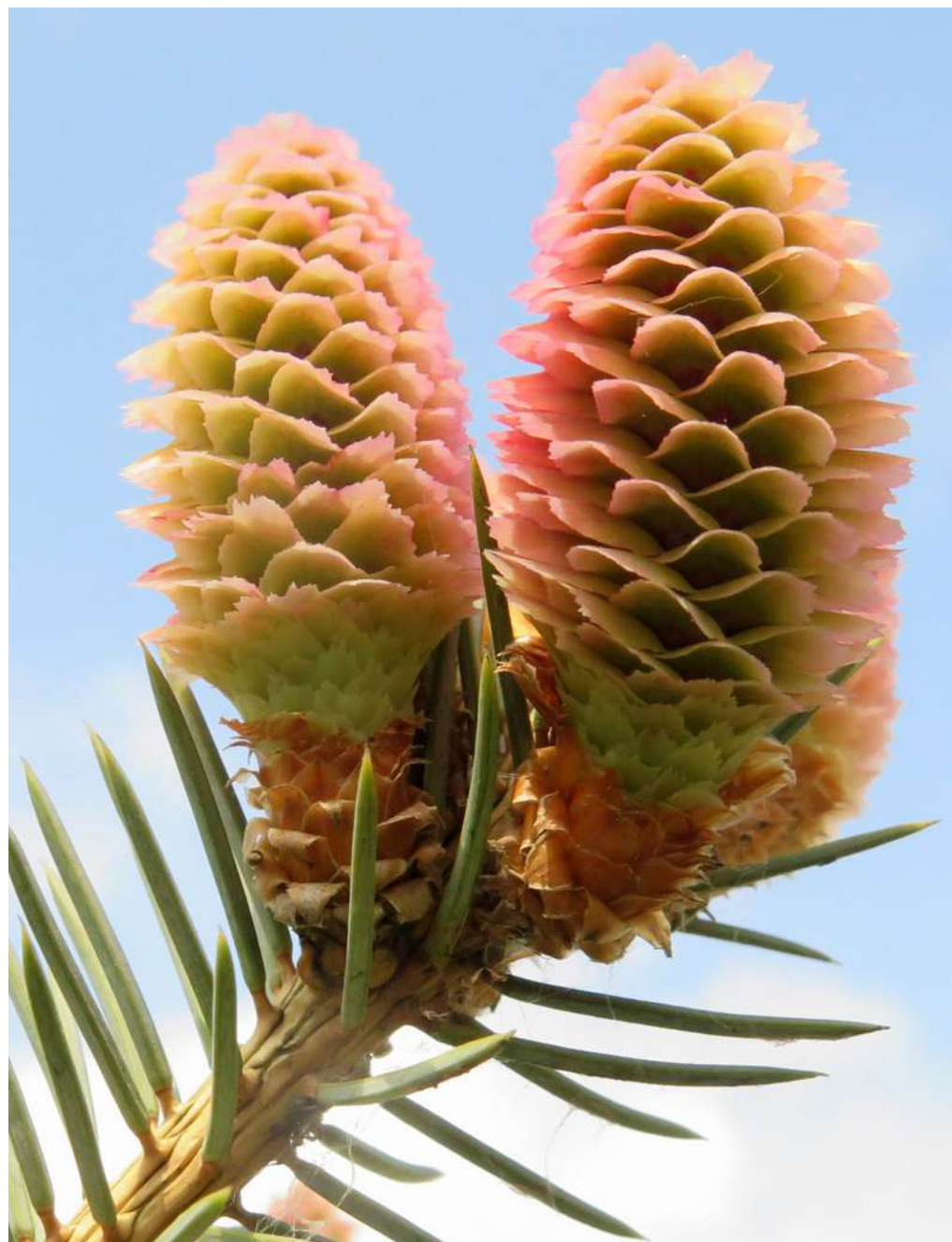
... rozmaitości maja 2019 roku ...