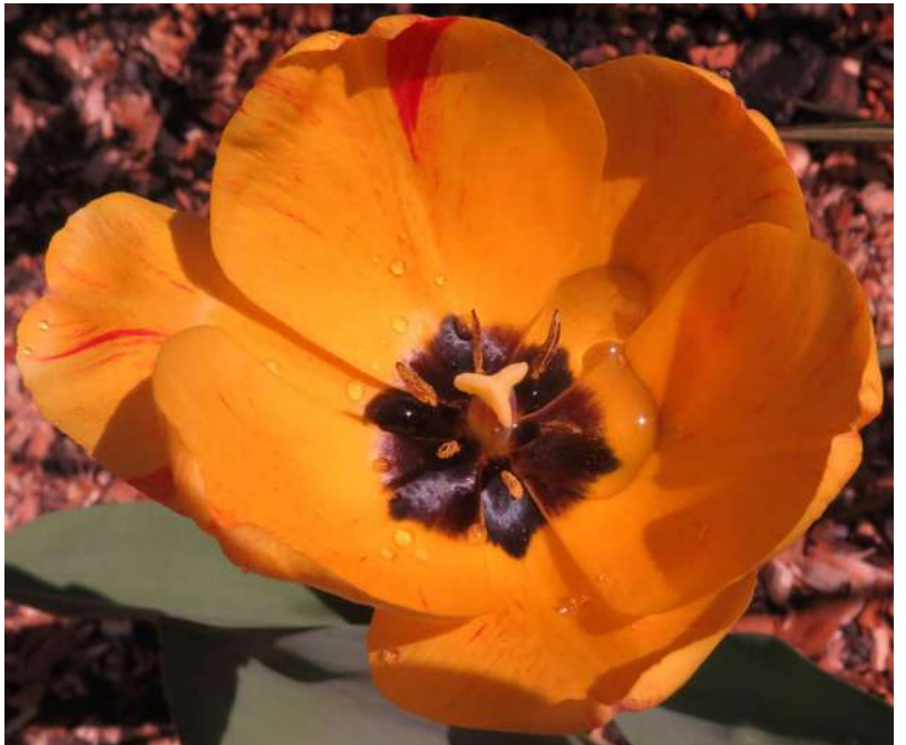
... z tulipanami w maju 2019 roku ...