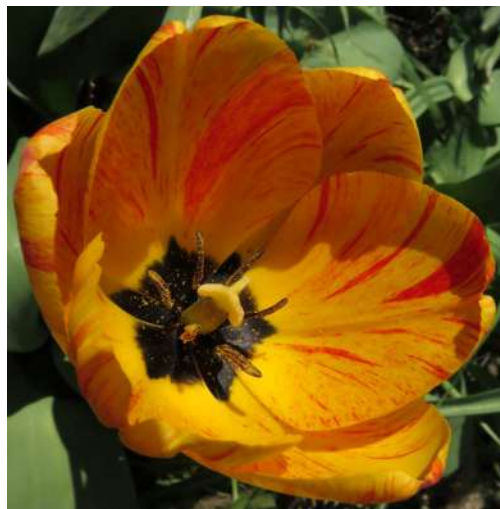
... tulipany w maju 2019 roku ...