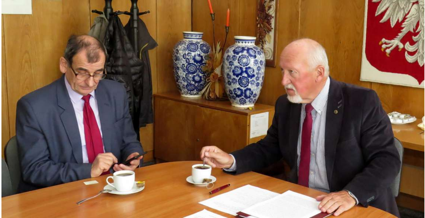
Relacja z zebrania Zarządu Głównego SGP W zebraniu Zarządu Głównego Stowarzyszenia Geodetów Polskich, jakie odbyło się w dniu 16 kwietnia