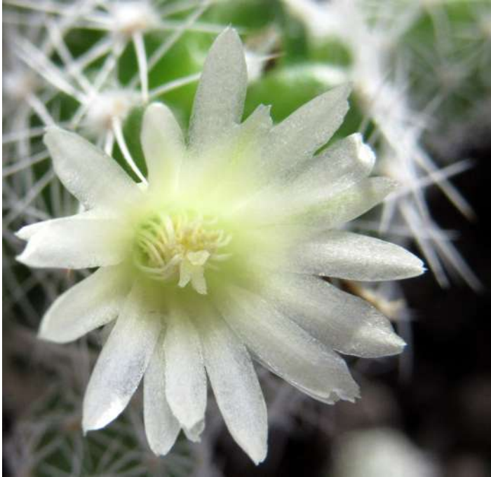
... różności stycznia 2019 roku ...