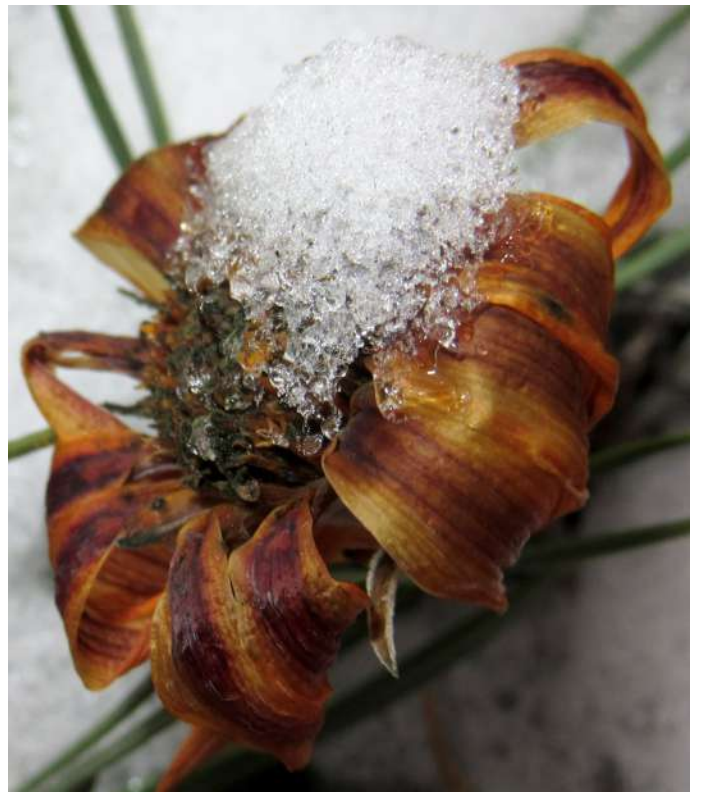
... zima grudnia 2018 roku ...