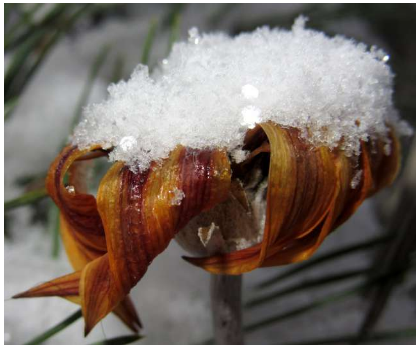
... zimowe różności grudnia 2018 roku ...