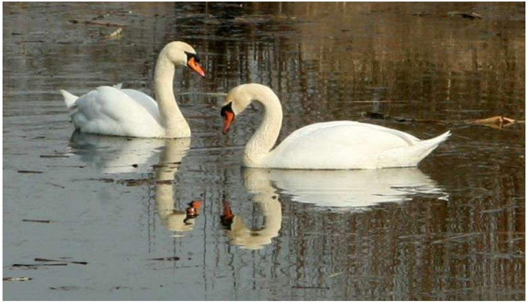
... oznaki marcowego przedwiośnia 2018 roku ...