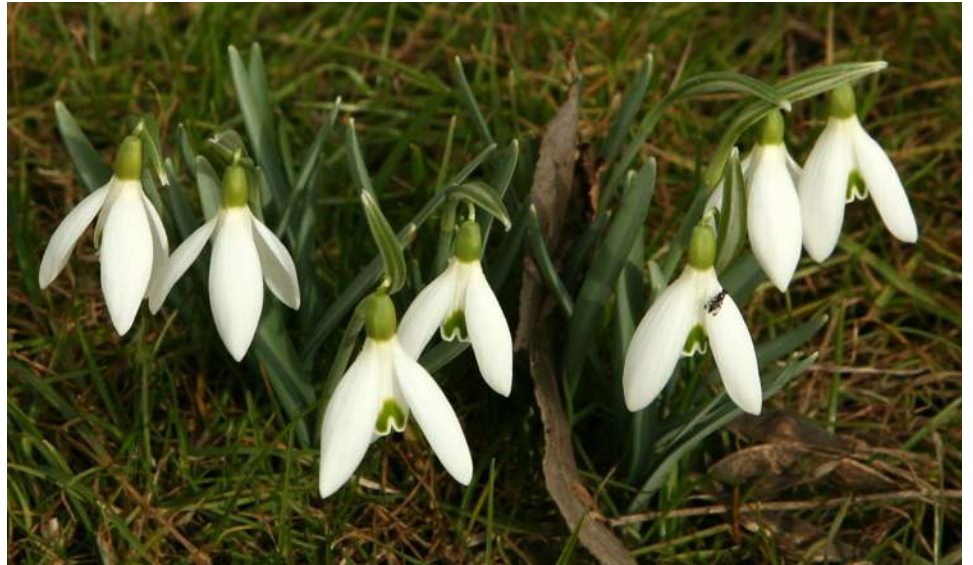
... kwitnienia marcowe 2018 roku ...