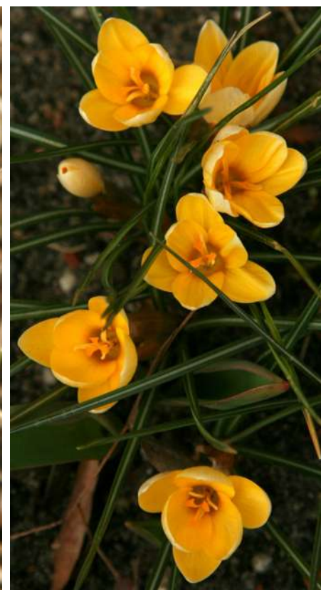
... nieco wiosny w zimowe dni marca 2018 ...