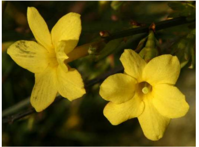
... różnaitości początku stycznia 2018 ...