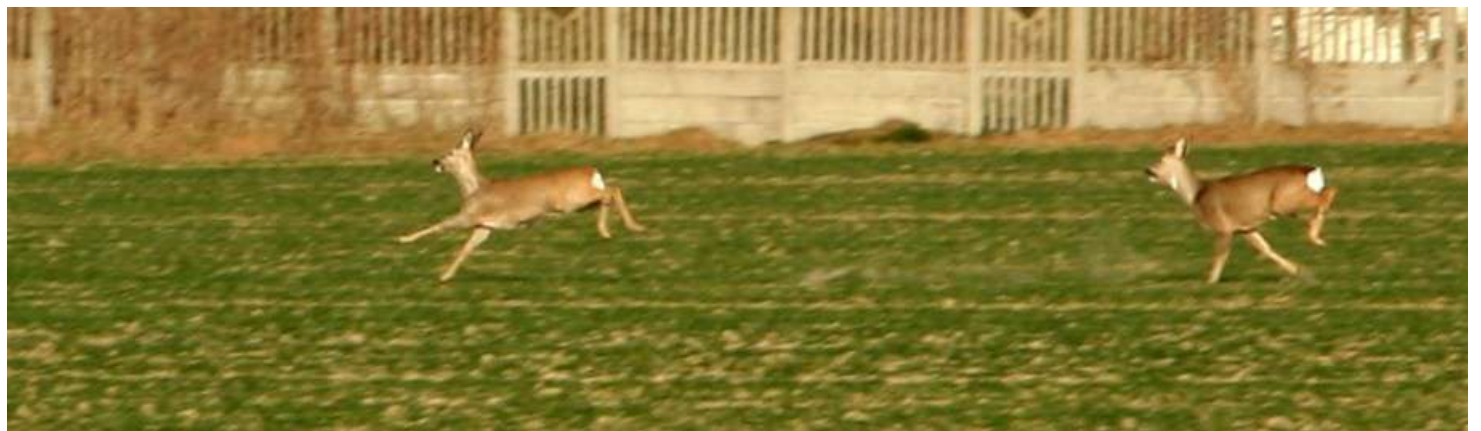
... na podbydgoskich polach w styczniu 2018 roku ...