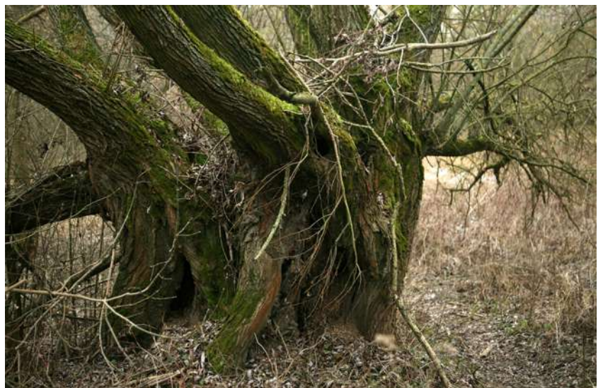
.. bydgoski nadwiślański las w styczniu 2018 ..