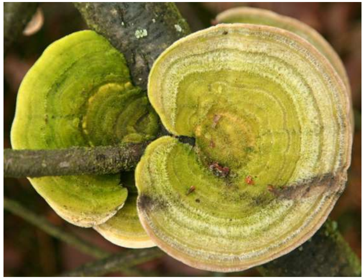
... na początku 2018 roku w bydgoskich lasach ...