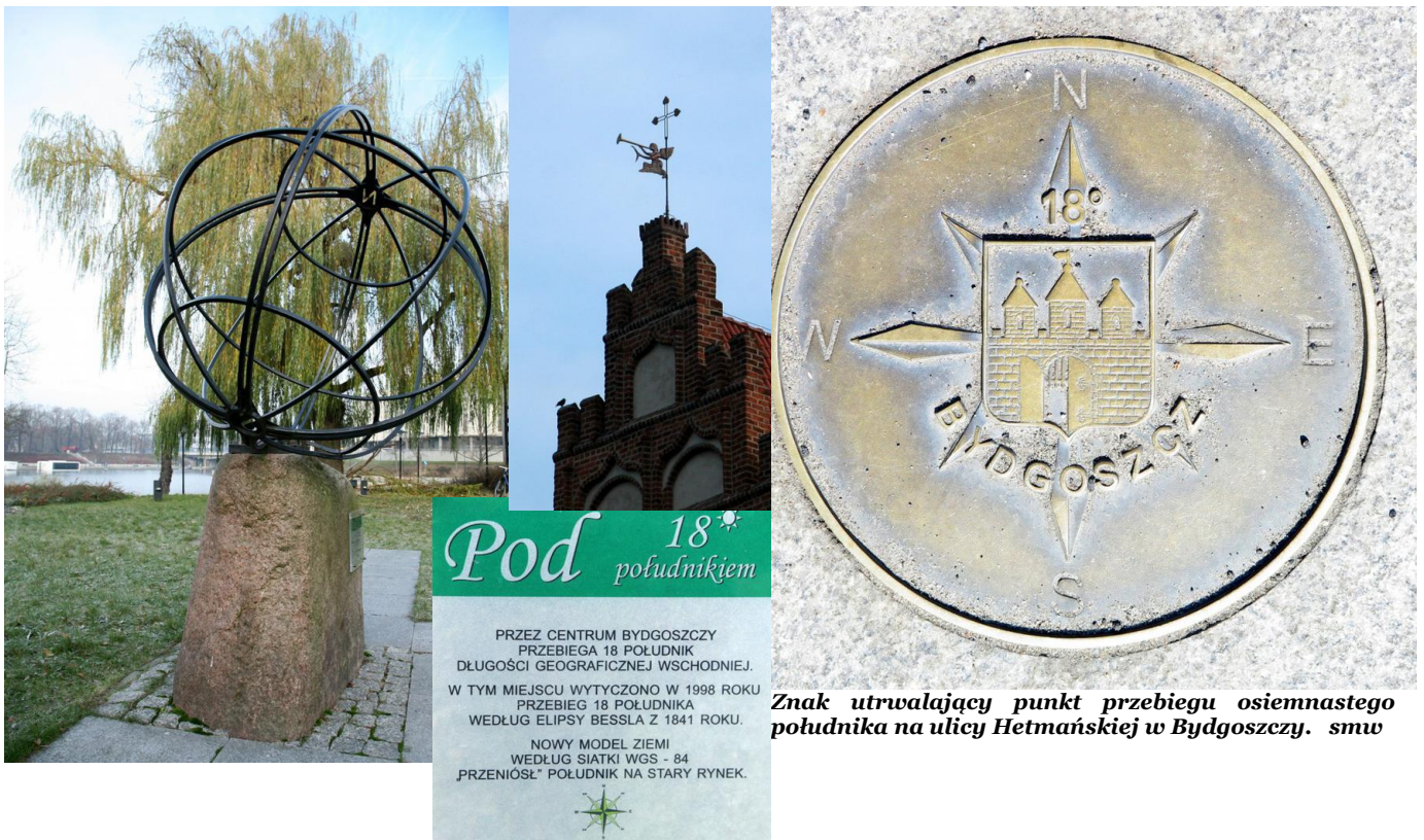
Znak utrwalający punkt przebiegu osiemnastego południka na ulicy Hetmańskiej w Bydgoszczy. smw

Uważny przechodzień, gdy znajdzie się w Bydgoszczy na ulicy Hetmańskiej (w bliskim sąsiedztwie szkoły), może natknąć się na znak utrwalający ślad przebiegu południka osiemnastego (zdjęcie prawe).