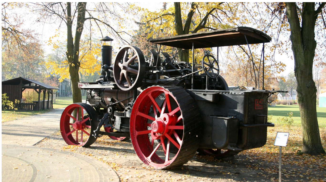
Lokomobila samobieźna produkcji Kemna-Breslau, rocznik 1927