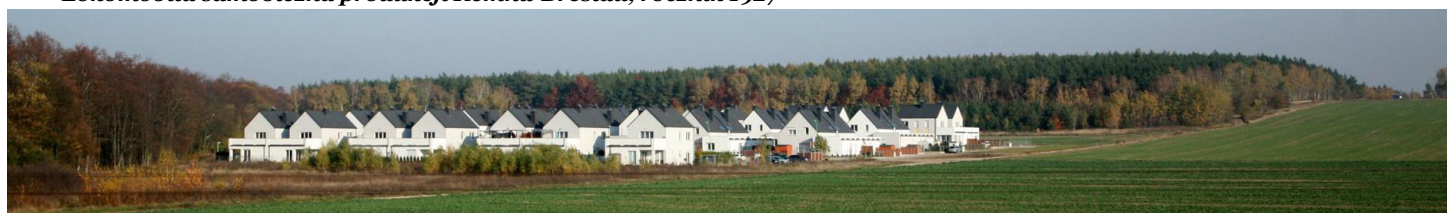
„Osiedle Poetów” w Szreniawie