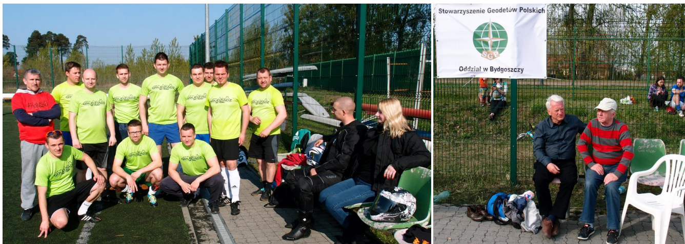
Drużyna geodetów grudziądzkich ...;

W finale spotkały się drużyny „Nie Zniszczalni” i „Ponad Podziałami”. Mecz zakończył się sukcesem drużyny „Nie Zniszczalni”, która pokonała drużynę „Ponad Podziałami” w stosunku 4:1.