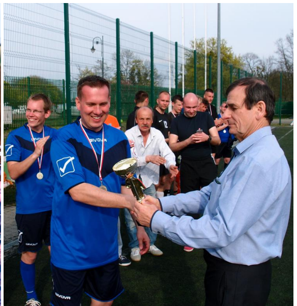
Puchar w ręce kapitana zwycięskiej drużyny ...