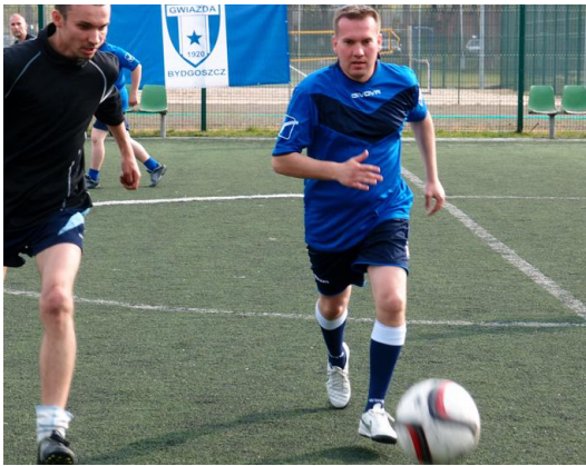
... z piłką ku bramce ...;