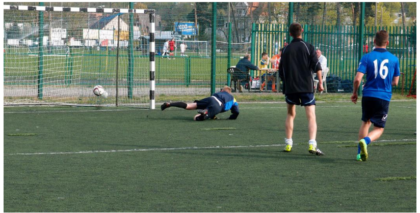
... nieskuteczna ofiarność bramkarza ...