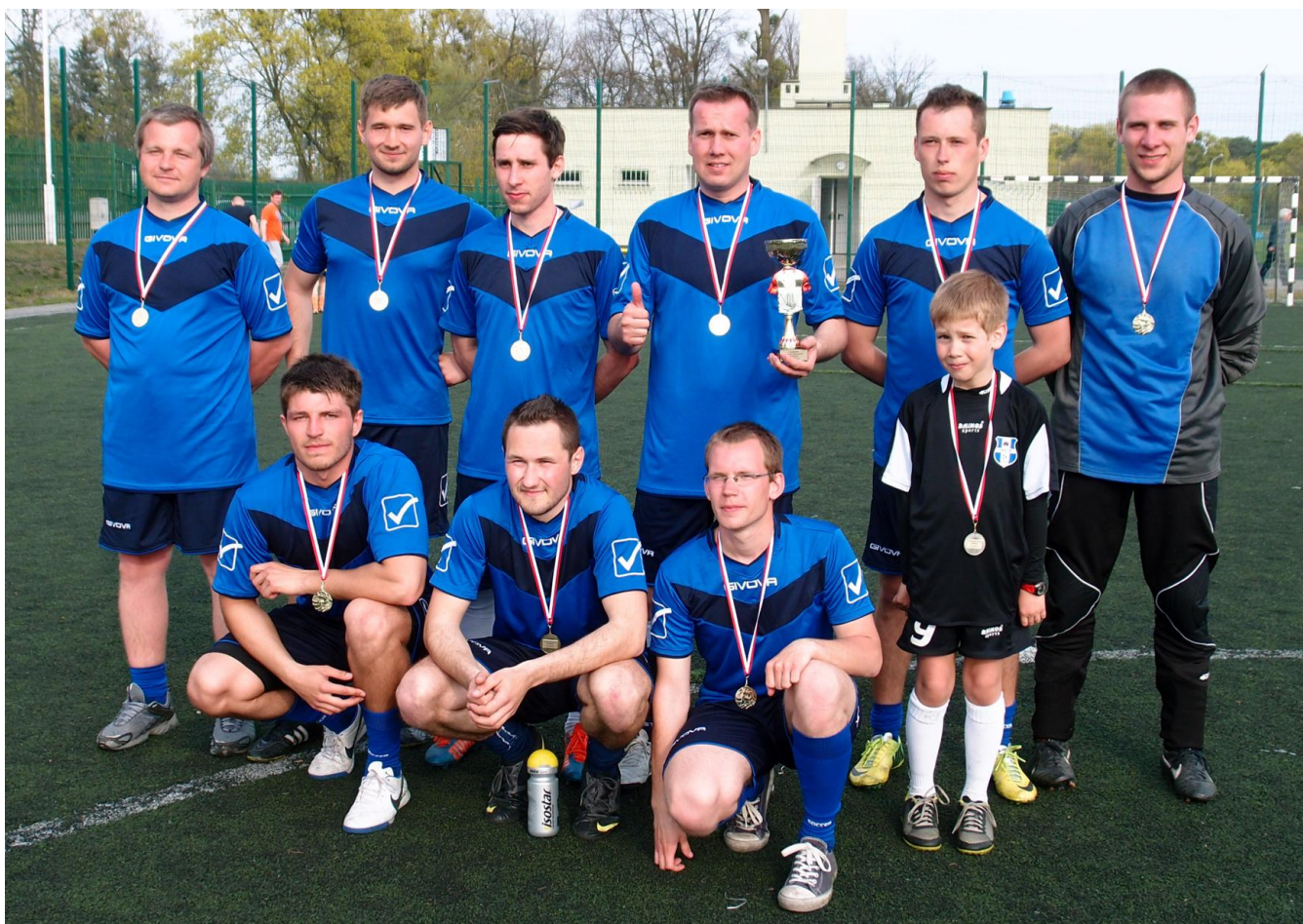
Zwycięska drużyna i jej najmłodszy zawodnik ...