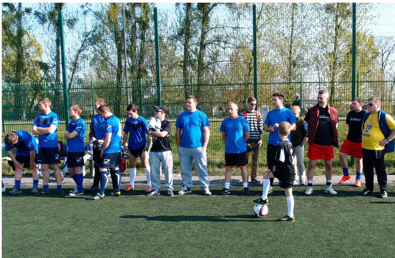
... ja się Was nie boję i dam sobie radę w każdym meczu ...