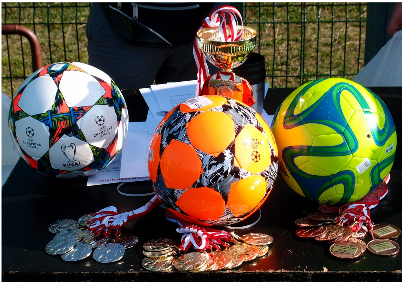
... trofea dla najlepszych piłkarzy wśród geodetów województwa kujawsko-pomorskiego ...

Rozgrywane zawody, mimo zaciętej rywalizacji, miały bardzo przyjazny przebieg i odbywały się w piknikowej atmosferze. Pomagały w tym wspaniała pogoda, stanowisko grillowe, przy którym można było się posilić, ale przede wszystkim licznie przybyli kibice.