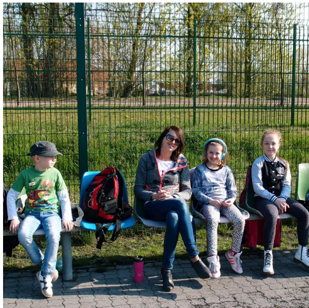
... wierni i życzliwi kibice ...

Rozgrywane zawody, mimo zaciętej rywalizacji, miały bardzo przyjazny przebieg i odbywały się w piknikowej atmosferze. Pomagały w tym wspaniała pogoda, stanowisko grillowe, przy którym można było się posilić, ale przede wszystkim licznie przybyli kibice.