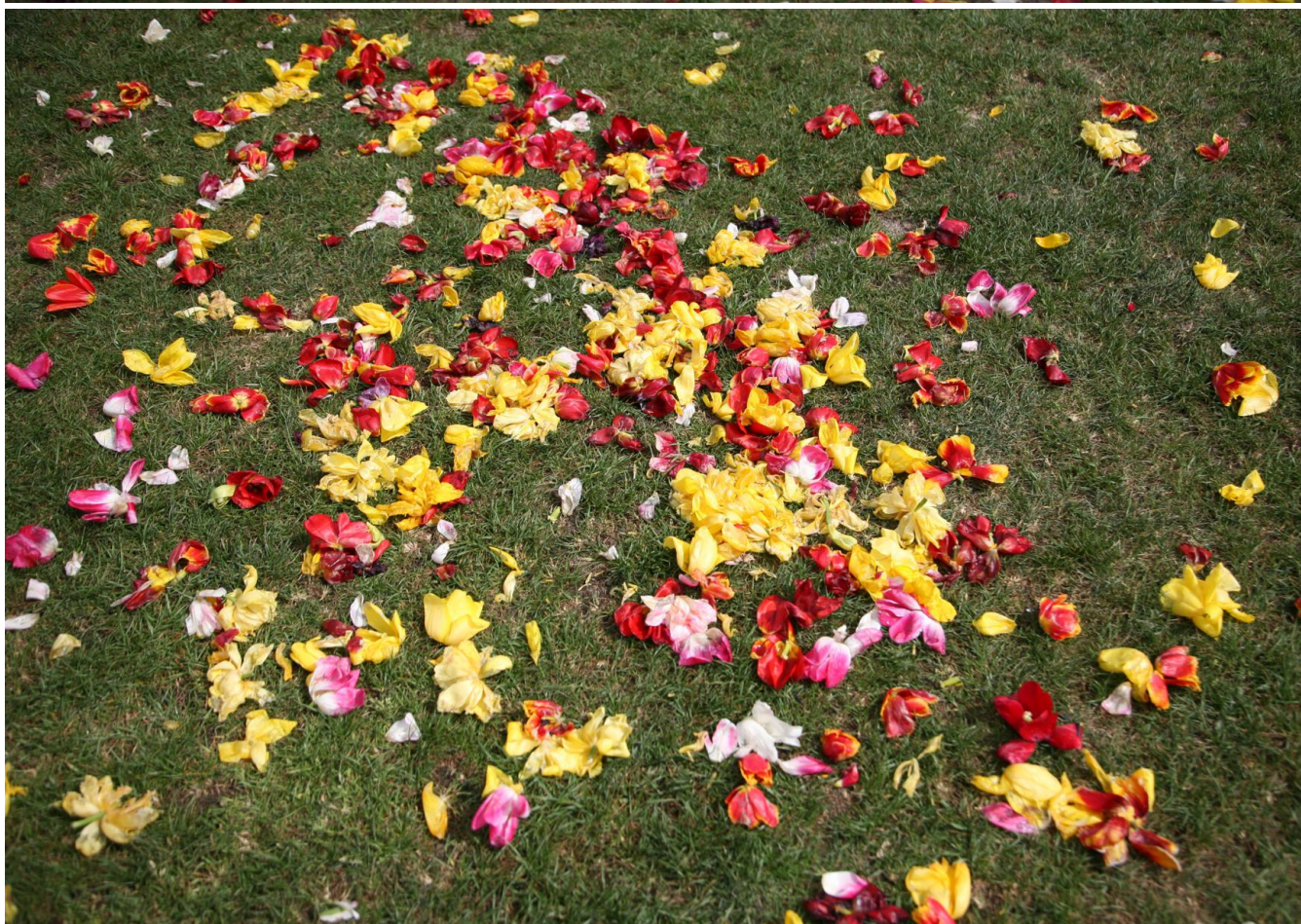
Po nocy z soboty na niedzielę bydgoszczanie mogli oglądać skutki dzikości i nieposzanowania wysiłku, życzliwości i woli umilenia majowych dni przez grupę pasjonatów działających w ramach XLVI Bydgoskich Dni Techniki 2015 , organizowanych przez Bydgoską Radę Federacji Stowarzyszeń Naukowo-Technicznych NOT.