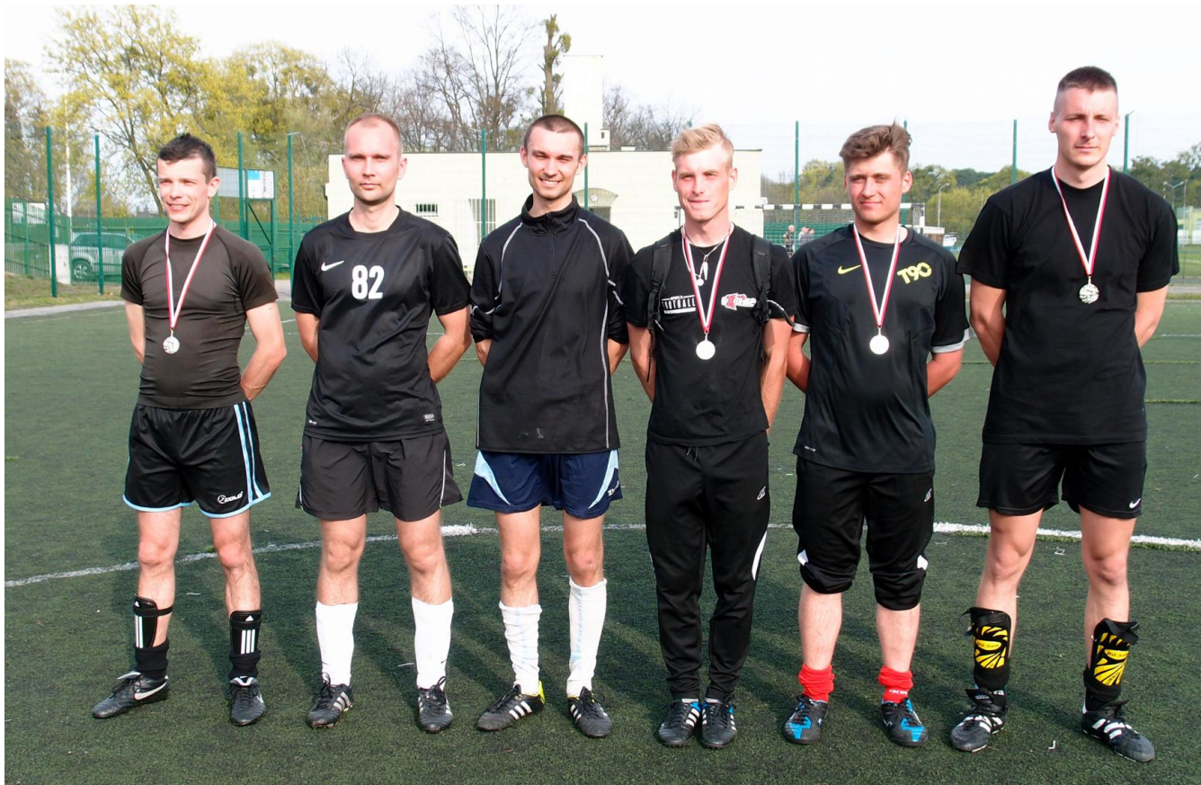
... drużyna „Ponad Podziałami”, która w turnieju zajęła drugie miejsce ...