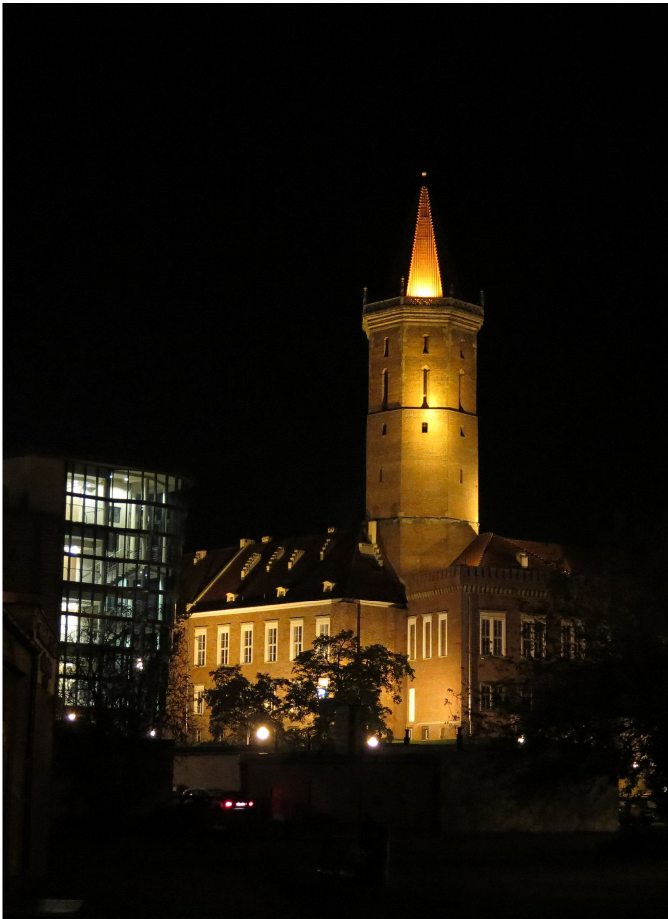
... wieża Św. Piotra zamku w Legnicy ...

Muzeum Miedzi wystawy poświęconej szlachcie na Śląsku, jak i wspinaczka na wieżę zamku Piastów. Zaproszenie do udziału w konferencji „za rok” było ostatnim pożegnalnym akcentem spotkania. smw