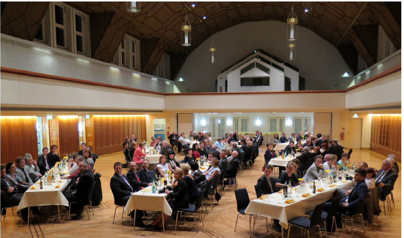
... uczestnicy XX Międzynarodowych Dni Geodezji podczas kolacji ...

Poniedziałkowy wieczór wypełniło przyjacielskie spotkanie przy kolacji i muzyce.