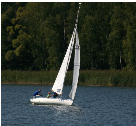
Załoga MGGP AERO w akcji ...