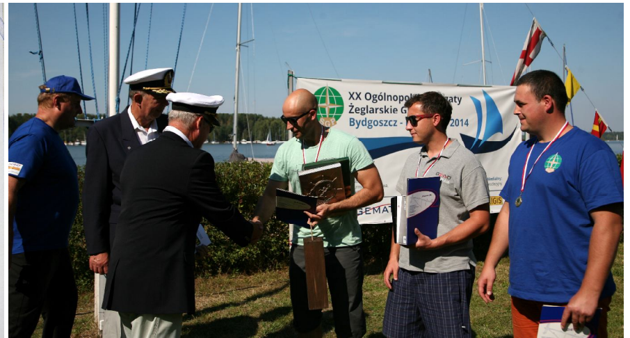
Adres gratulacyjny GGK dla zwycięskiej Załogi;