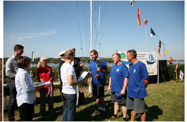
Laury dla najlepszych ...;