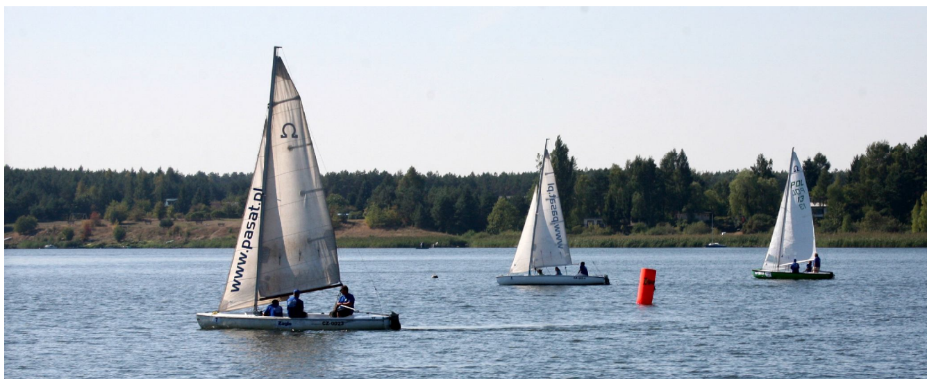
Żeglarze w ostatnim biegu dwudziestych regat żeglarskich geodetów ...