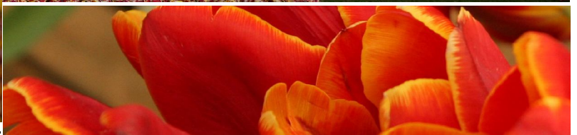
... wśród zwiedzających był też „gość niezwykły” ...