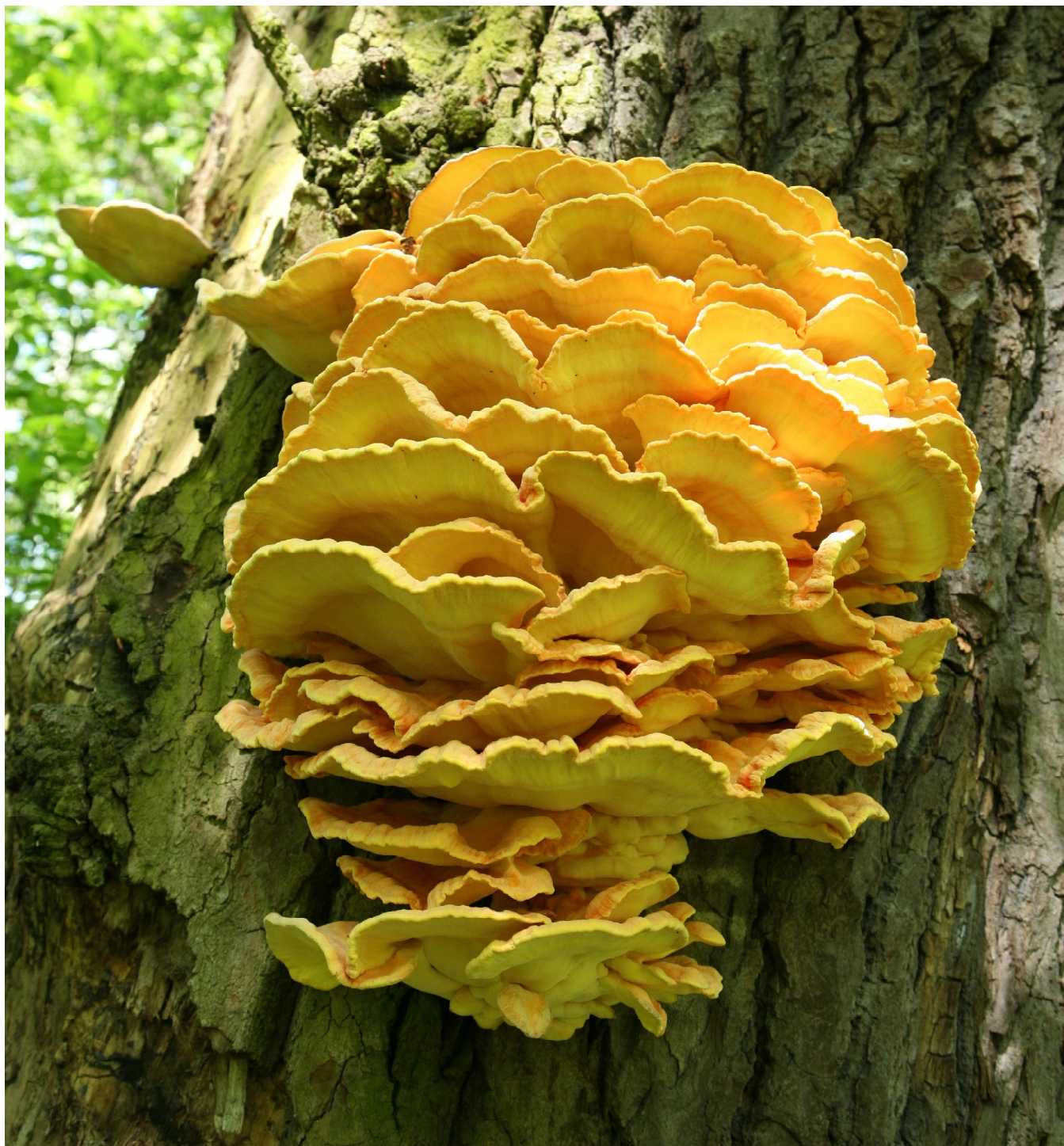
... „owoc” wymuszonego współżycia topoli w Parku „Wielka Kępa” Doliny Dolnej Wisły ...