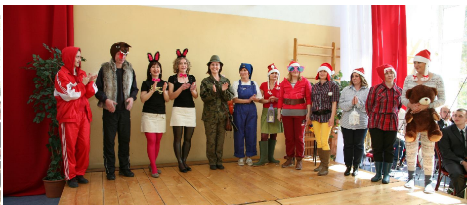
... nauczyciele po przedstawieniu dla swoich uczniów ...

Wyprowadzenie sztandaru Szkoły zamykało część oficjalną spotkania, po której nauczyciele dali, w formie krotocwilnej, przedstawienie uwspółcześnionej bajki o czerwonym Kapturku.