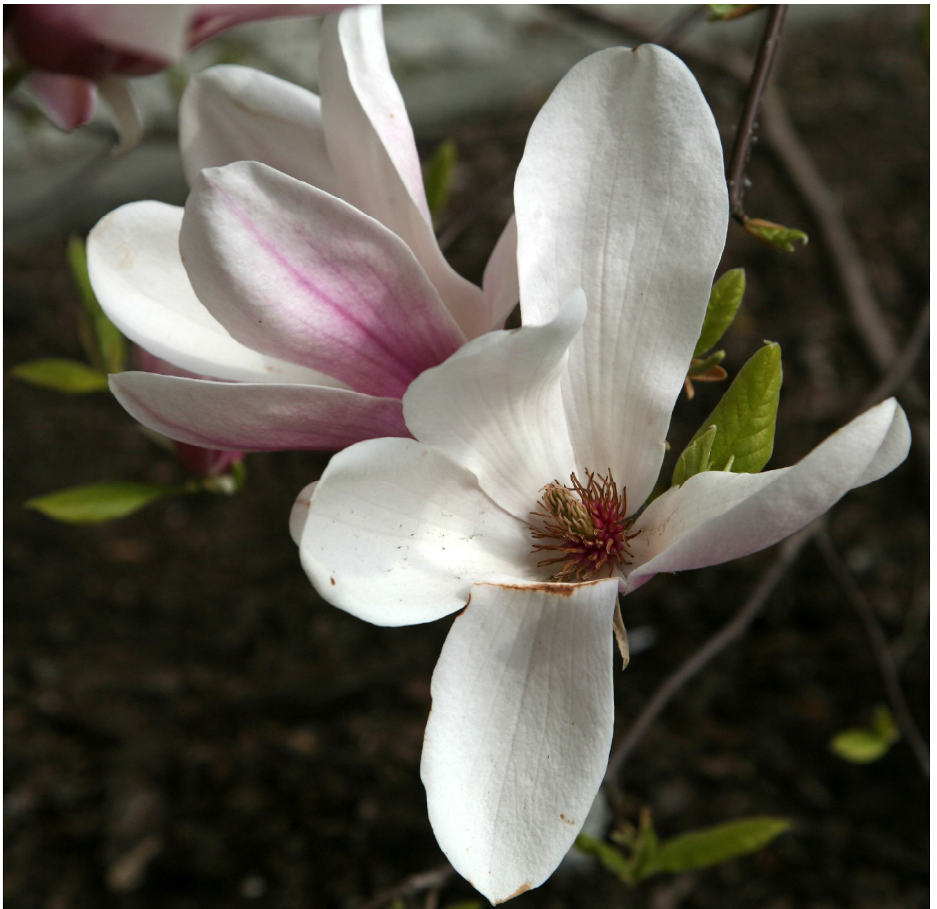
... bydgoskie zwiastuny wiosny 2014 ...