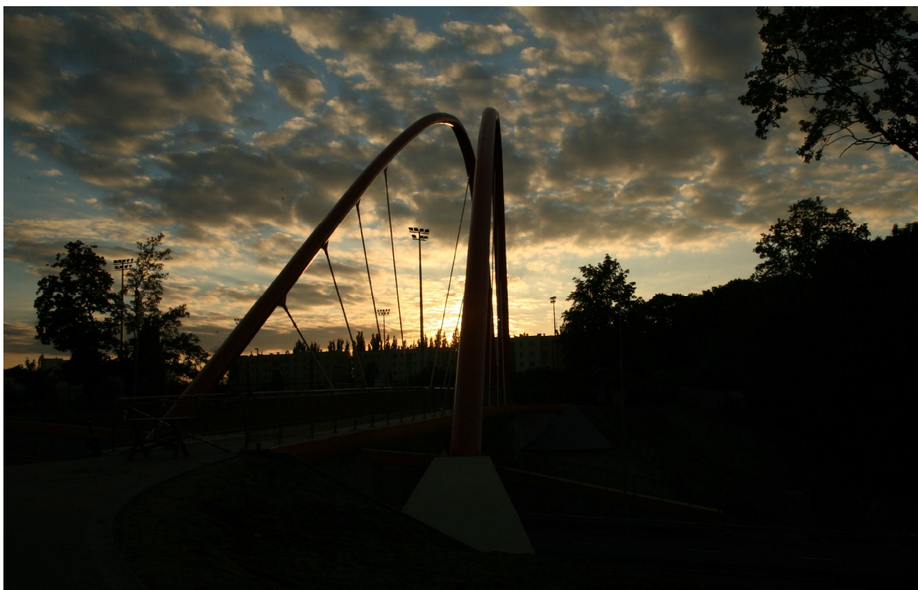
... wiadukt w ciągu bydgoskiej Trasy Akademickiej, o zachodzie słońca ...