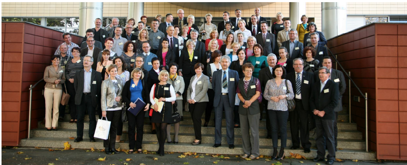
... na wspólnej fotografii ...

Przedmiotem prezentacji była również bieżąca działalność legislacyjna prowadzona w Głównym Urzędzie Geodezji i Kartografii, a także opracowania naukowe i rozwiązania techniczne, tematycznie związane z problematyką konferencji. W drugim dniu obrad szukano sposobów na rozwiązania prawne problemów, które pojawiają się w działaniach zespołów uzgadniających sytuowanie projektowanych sieci uzbrojenia terenu.