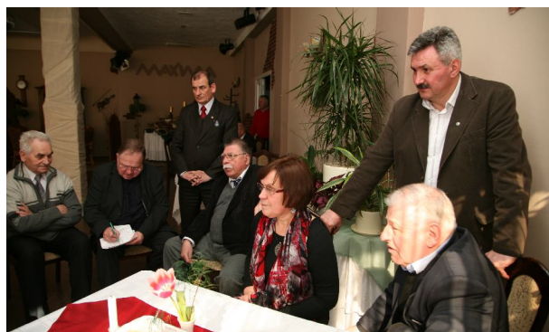
Podczas wyborów Prezydium nowego Zarządu Oddziału ...