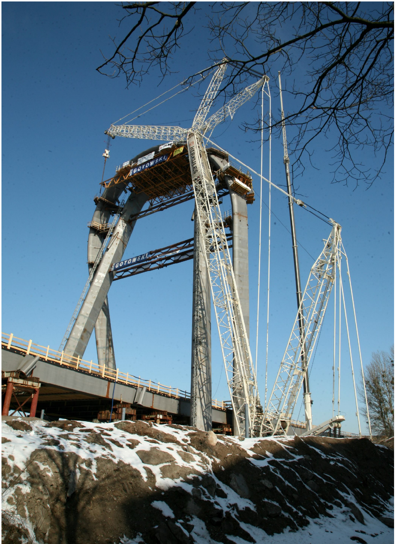
Po zmontowaniu obu części pylonu na moście przez Brdę w ciągu ulicy Ogińskiego, w Bydgoszczy