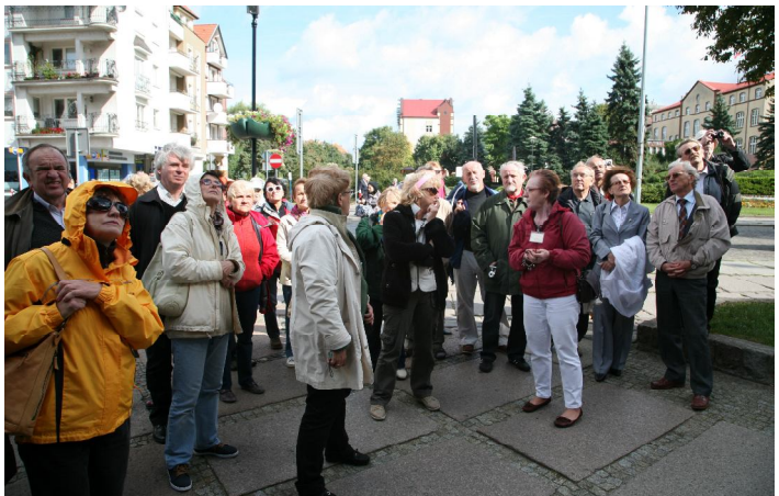
... na wycieczce w Kołobrzegu ...