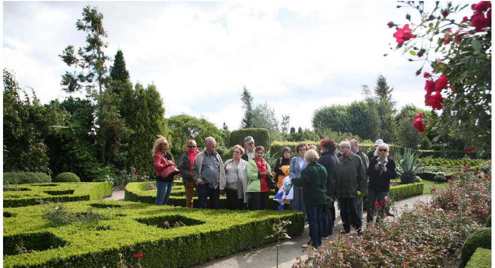
... w ogrodach „Hortulus” w Dobrzycy ...