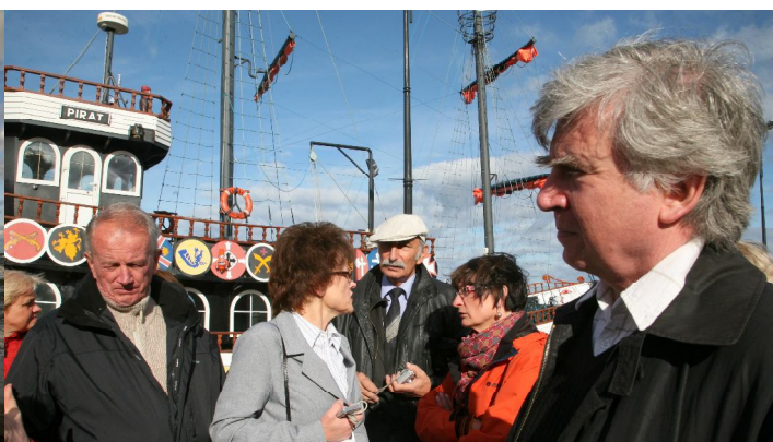
...w oczekiwaniu na wejście na pokład „Pirata” ...