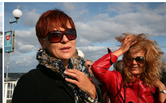
... nasze piękne Olsztynianki w Kołobrzegu ...