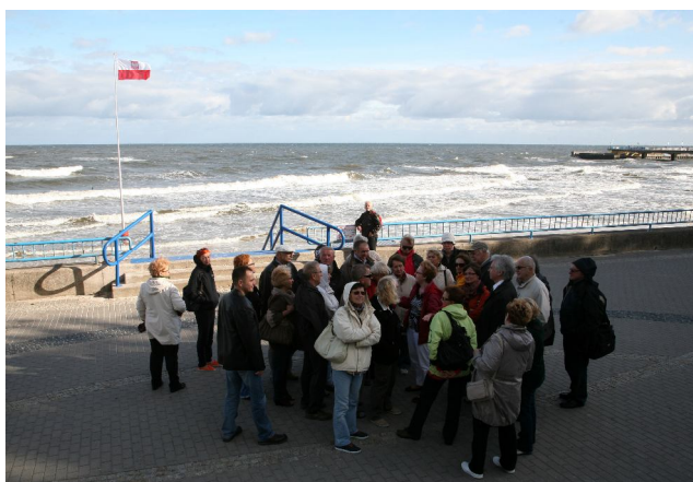
... nad wzburzonym Bałtykiem ...;