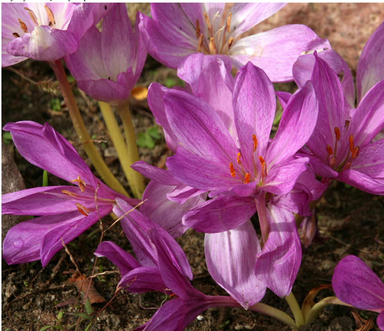
... zwiastun słonecznej jesieni i zapowiedź zimy, Colchicum autumnale ...