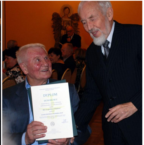
... a Leopoldowi Witulowi Dyplom „Zasłużony Senior SGP”