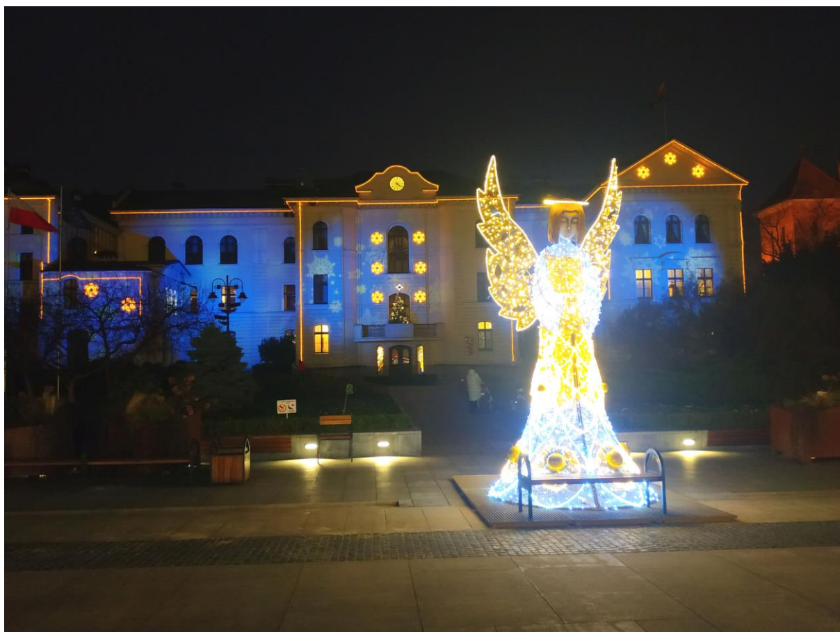
Sporządził: Jakub Nowicki

Prezes Bolesław Krystowczyk uznając program zebrania za wyczerpany podziękował obecnym za aktywny udział w przebiegu obrad, zamknął spotkanie.