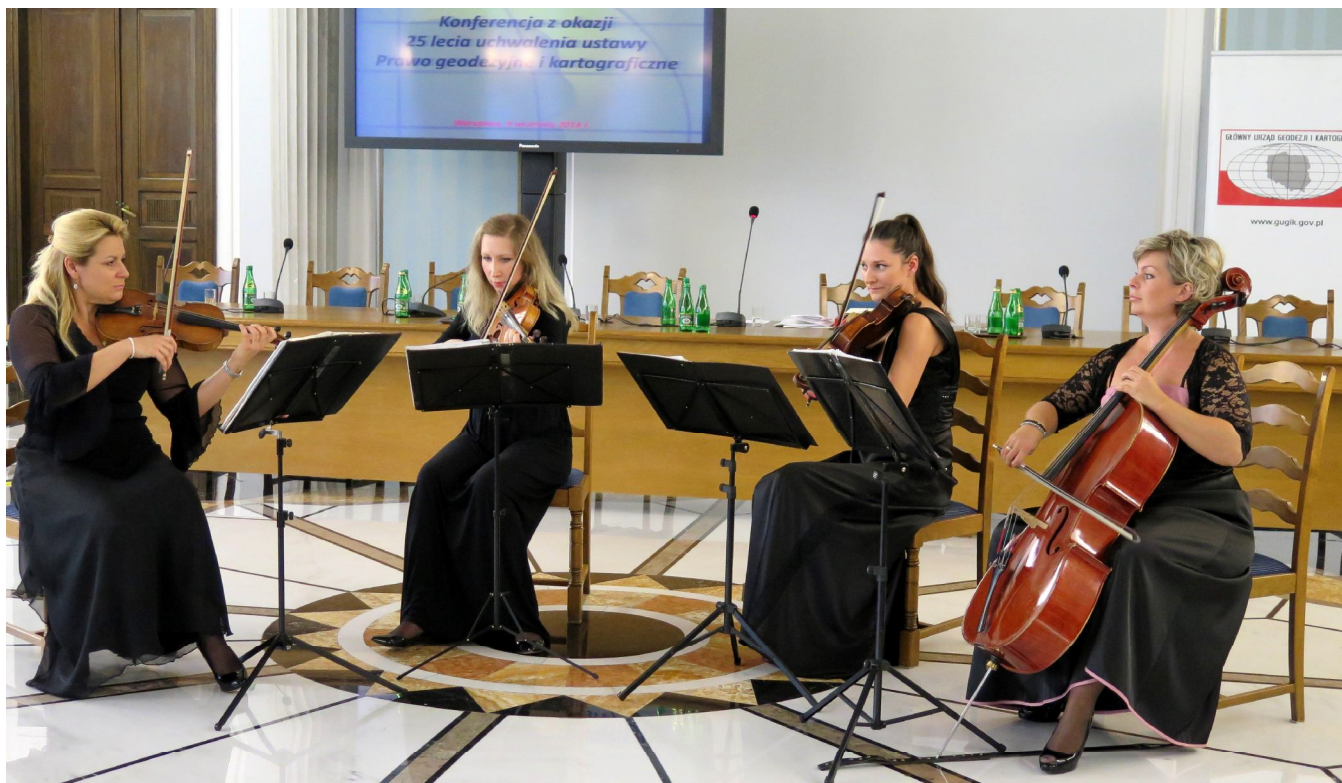
... ozdobą spotkania był koncert kwartetu smyczkowego ...