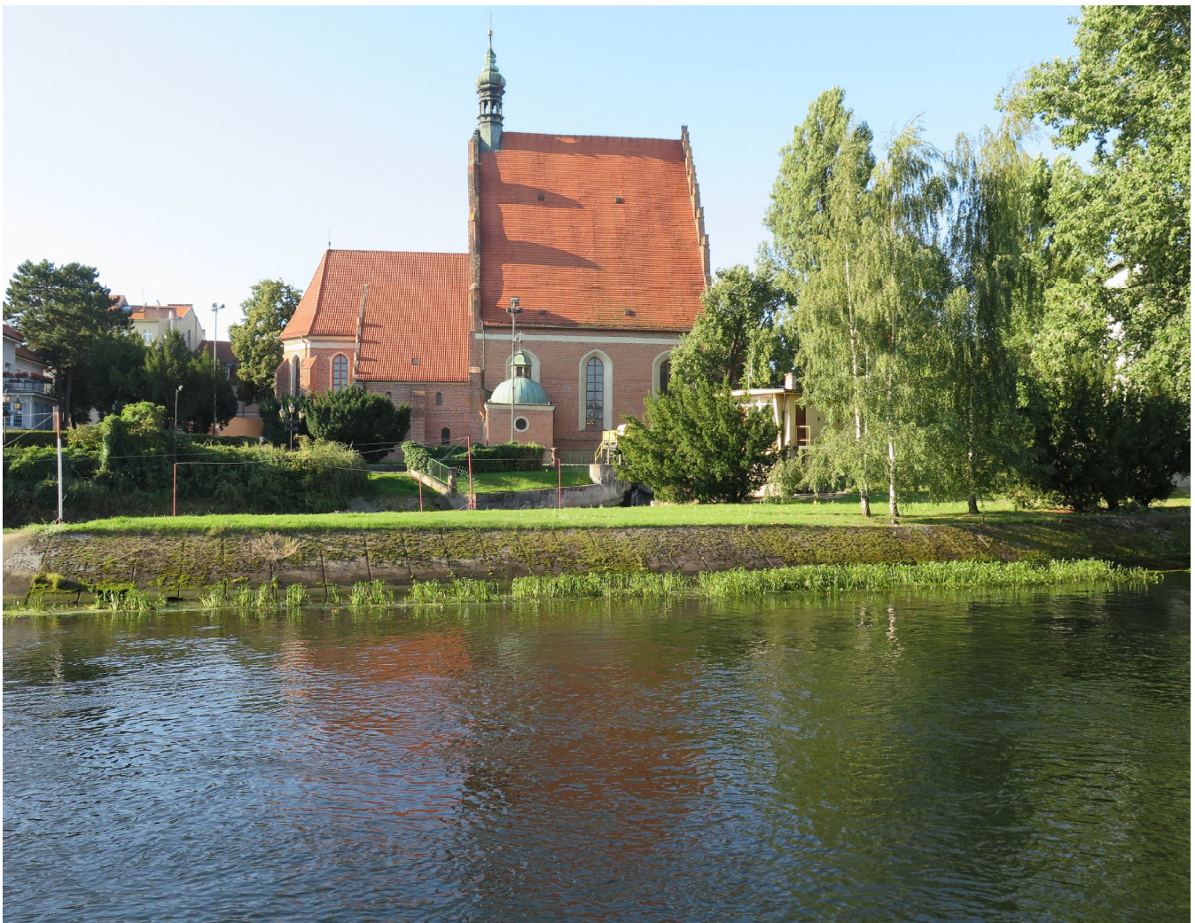
... bydgoska fara ...