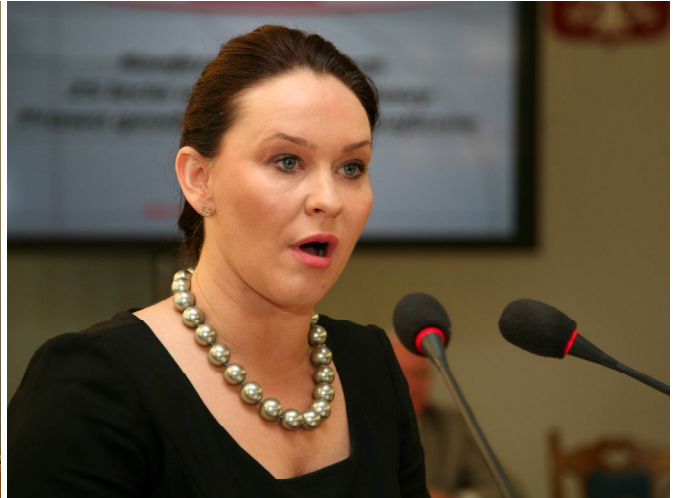
Przemawia senator Angelika Moździonowska

Angelika Moździonowska przywołała zalety i dobre cechy geodety, życzyła, aby wyniki prac geodetów służyły dobru gospodarki i obywateli naszego kraju.