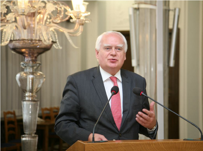
Przemawia Minister w Kancelarii Prezydenta RP Olgierd Dziekoński;

Olgierd Dziekoński stwierdził, że ustawa sprywatyzowała wykonawstwo geodezyjne i przywróciła osobistą odpowiedzialność geodety za wykonaną pracę. Dobra praca geodetów daje poczucie bezpieczeństwa, na przykład w budownictwie. „ Serdecznie dziękuję geodetom za wkład w rozwój gospodarczy kraju i bezpieczeństwo ”.