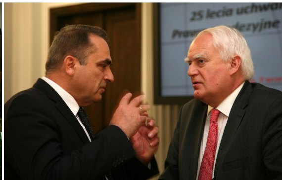
Eugeniusz Grzeszczak, Olgierd Dziekoński

Wystąpienie wprowadzające Głównego Geodety Kraju stanowiło historyczny zarys planów i działań, które prowadziły, poczynając od końca XVIII wieku, do przyjęcia przez Sejm RP Prawa geodezyjnego i kartograficznego oraz ustawy o infrastrukturze informacji przestrzennej .